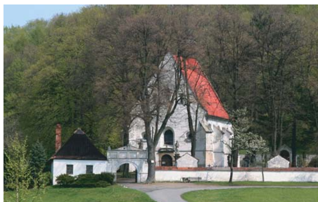
kostel Narození Panny Marie (Kostelíček)