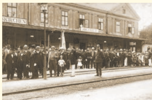
Kouzelný svět vlaků a železnice poodhalí výstava Plnou parou vpřed, která odstartuje v Gotickém sále Staré radnice v Hranicích slavnostní vernisáží ve čtvrtek 17. října v 17 hodin. Výstava má připomenout výročí 170 let od chvíle, kdy Hranicemi projel první vlak. Více na straně 9