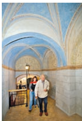
K prohlídce lákal i mázhaus.

Nepřišel Vám do schránky Hranický zpravodaj? Volejte 581 607 479.