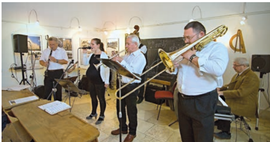
Na Staré radnici hrála skupina Olomoucký Dixieland Jazz Band.