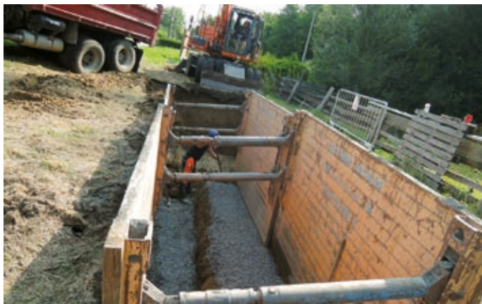
Výkop pro oddělenou splaškovou a dešťovou kanalizaci v ulici Pod Křivým.

Dostavba kanalizace v Hranicích, kterou provádí akciová společnost Vodovody a kanalizace Přerov, je největší akcí za posled-