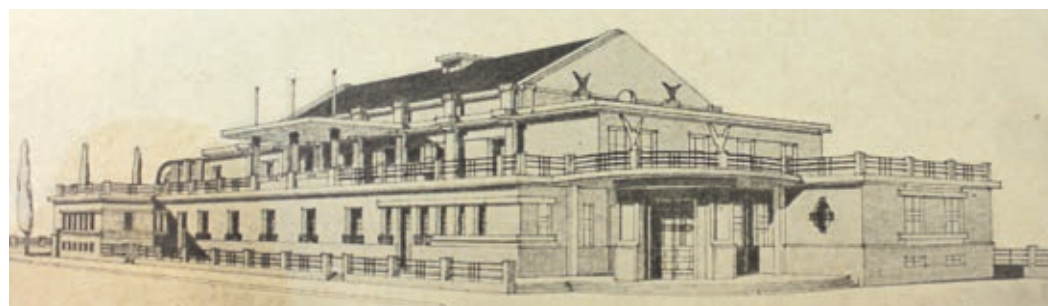
Návrh na stavbu sokolovny přerovského architekta Aloise Pilce.

V roce 1920 už eviduje hranický Sokol 400 členů. Hranice se staly sídlem 11. okrsku Středomoravské župy Kratochvílových a spojovaly celkem 10 jednot