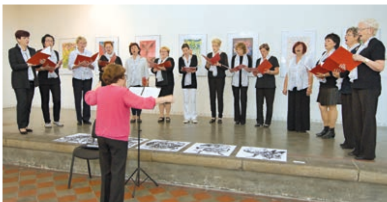
V Synagoze vystoupil Ženský pěvecký sbor Hranice.