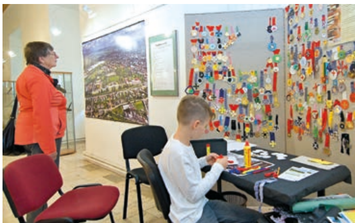
Na výstavě Rozkaz zněl jasně děti vyráběly medaile. Soutěžít o ceny mohou až do 8. října, kdy výstava končí.