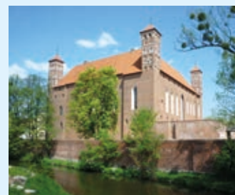
Přednáška o polských hradech se koná ve čtvrtek 19. října.

Zájemci o historii, nejen vojenskou, ale také milovníci zvláště cihlové architektury a všichni zapálení cestovatelé se mohou na malou chvíli přenést do severních oblastí Polska a navštívit řádové hrady a sídla Radzyń Chelminski, Szymbark, Kwidzyn, Sztum, Malbork, Bytów, Gniew, Frombork, Lidzbark Warmiński, Rezsze a některé další významné památky. Vstupné na přednášku je 50 korun. (mj)