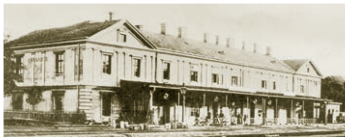
Historická fotografie Severního nádraží v Hranicích.

Městské muzeum v Hranicích připravuje v těchto dnech výstavu, která připomene výročí 170 let od okamžiku, kdy Hranicemi projel první vlak. Ten sem zavítal v sobotu 1. května 1847 po nově vybudované trati Severní dráhy císaře Ferdinanda z Lipníka do Bohumína.