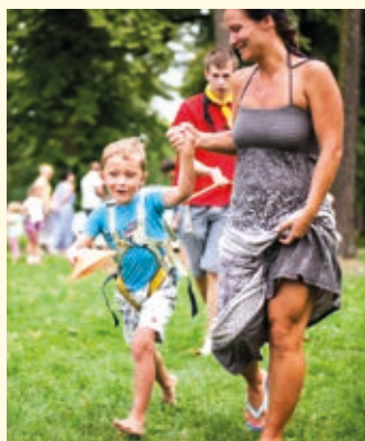
Připravené hry si užívali s dětmi i jejich rodiče.

Poslední srpnovou neděli se v Sadech Čs. legií uskutečnilo tradiční rozloučení s létem pod názvem Prázdninování. Akci si nenechalo ujít na 400 návštěvníků z řad nejmenších, jejich rodičů i prarodičů. Při zábavném odpoledni vystoupily skupiny F-dur Jazz band, Abraka Muzika či Modrý cimbál. Představili se zde i mladí talentovaní zpěváci ze soutěže Pop nota. Děti i dospělí si mohli vyzkoušet jízdu na koloběžkách, dozvědět se spoustu informací o skautingu, nebo se nechat povozit na člunech po řece Bečvě. (mš)