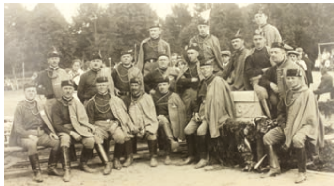
V roce 1921 bylo v sokolské zahradě, kterou odkázal Sokolům František Šromota, upraveno cvičiště. Snímek je z roku 1922.

Seriál k výroční založení Sokola Hranice najdete také na www.muzeum-hranice.cz