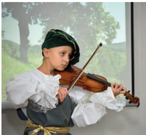
V Synagoze se uskutečnil projekt Poznej baroko.