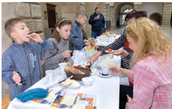
Veřejná snídáně se uskutečnila kvůli dešti ve dvoraně zámku. Pořadatele potěšila dvojice mladých lidí, kteří přišli s piknikovým košem. Donesli pro ostatní dvě pomazánky a rajčata a prozradili, že se na veřejnou snídani už dlouho těšili.