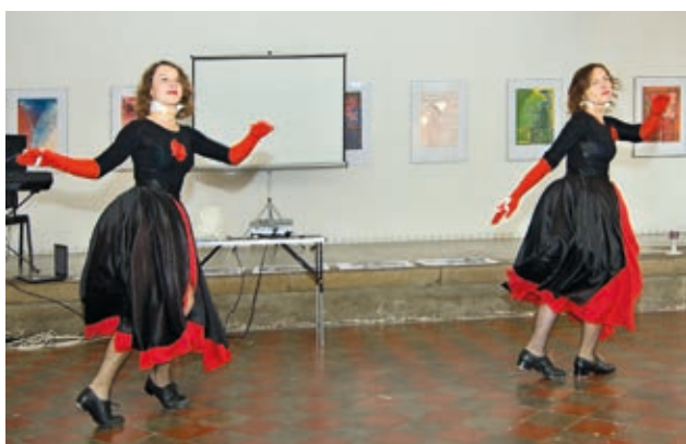
V Synagoze bylo stepařské vystoupení inspirované barokem.