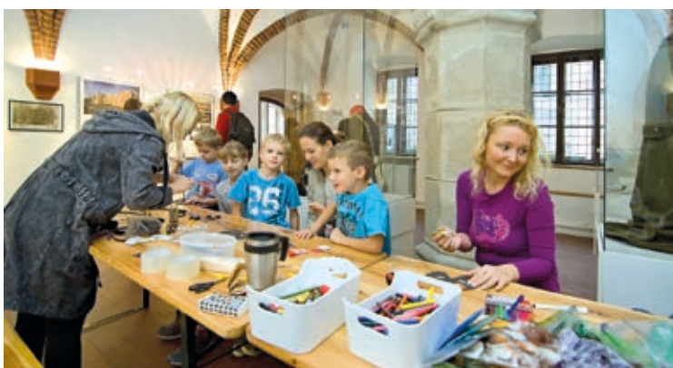
Na Staré radnici se vyráběly barokní vějíře, masky a šperky.