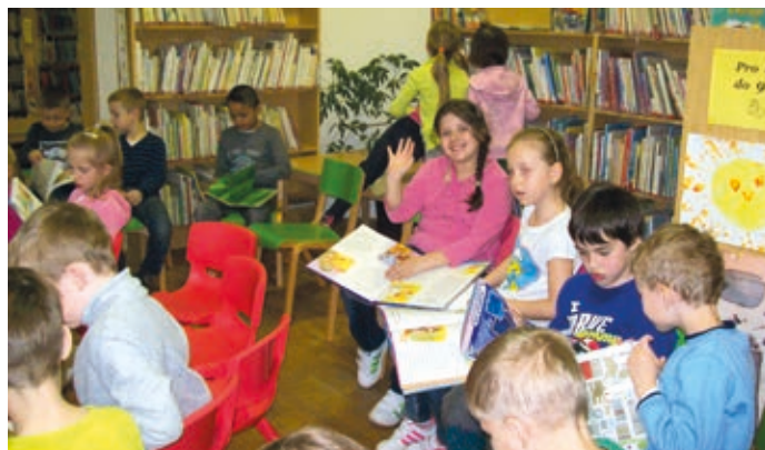
V Týdnu knihoven proběhnou i návštěvy školáků.

Návštěvníci knihovny se mohou těšit i na zábavnou, lehce