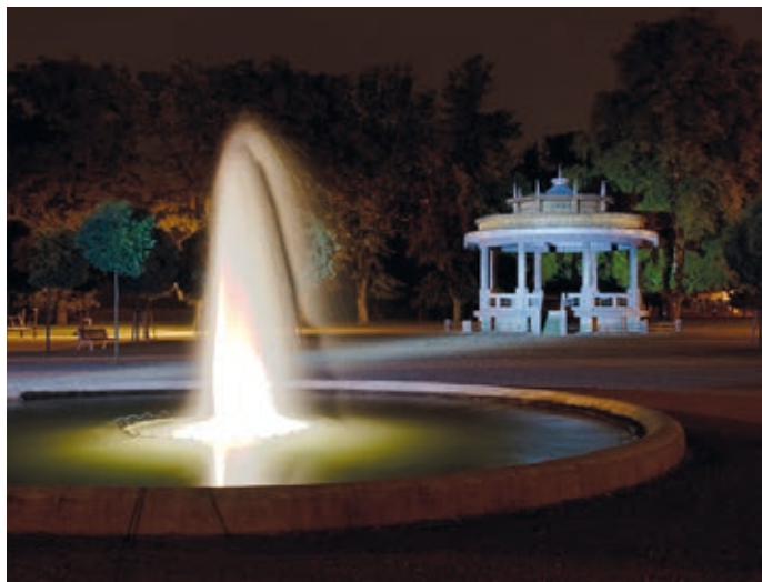
V kalendáři je i fotka městského parku, který vznikl počátkem 20. století.