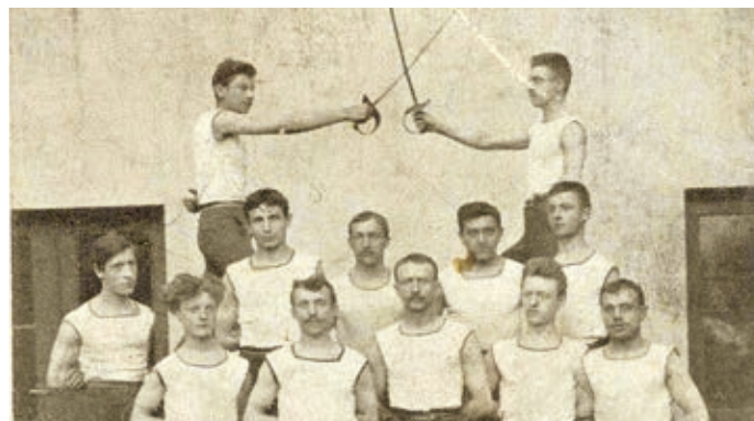
Sokoli se také věnovali šermu. Ten se ale neujal, stejně jako například střelba na terč nebo jezdecký sport.