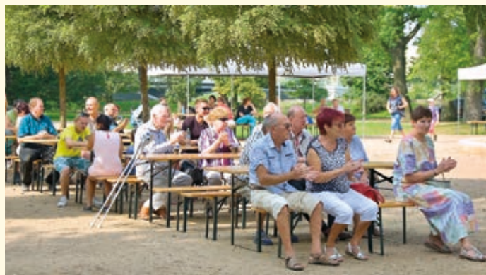
Vystoupení na pódiu bavilo i dospělé návštěvníky.