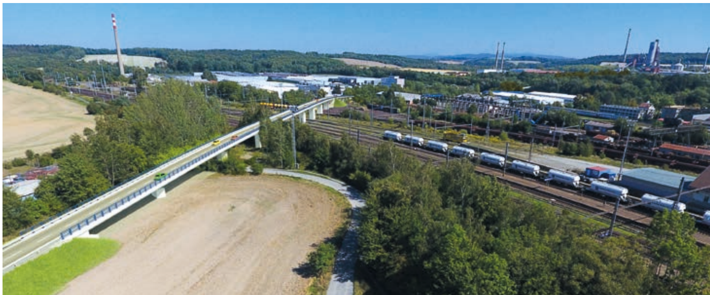
Vizualizace obchvatu. Na plánované trase obchvatu je i několik přemostění, to nejnáročnější povede nad železniční trať.