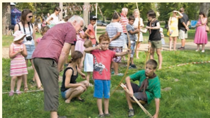
Děti si mohly vyzkoušet lukostřelbu, lanové překážky a další aktivity, které připravili skauti z Hranic.