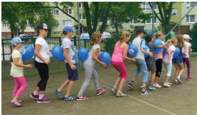
Na příměstských táborech panovala dobrá nálada při sportovních kláních.