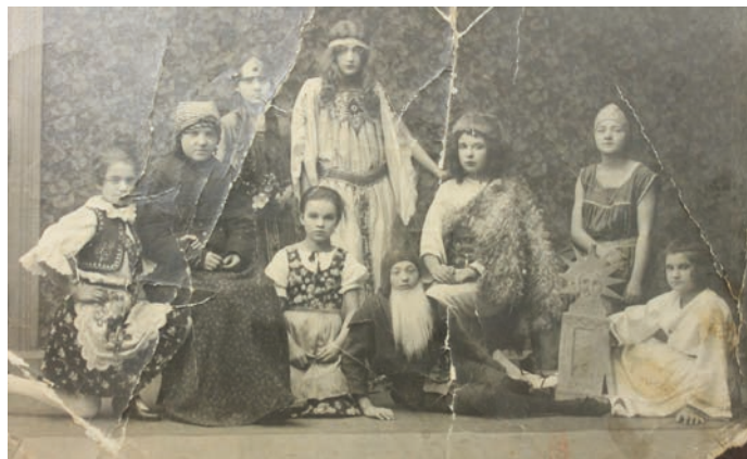
Kromě tělovýchovy se věnoval hranický Sokol také kulturní činnosti, hlavně ochotnickému divadlu.