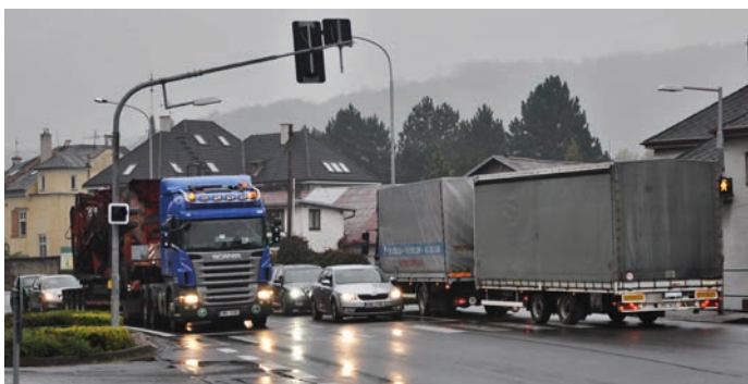
Palačovská spojka má odlehčit Hranicím od tranzitní dopravy přes město na Slovensko.

Projekt počítá s výstavbou nové komunikace Lešná – Palačov v délce pět kilometrů a úpravou čtyřkilometrového úseku silnice D48 mezi Dubem a Palačovem, do něhož bude nová silnice zaústěna. Součástí stavby jsou mosty, protihlukové stěny, úpravy okolních komunikací, přeložky a úpravy inženýrských sítí a jedna mimoúrovňová křižovatka. Předpokládaná cena stavby je 2,3 miliardy korun. (red)