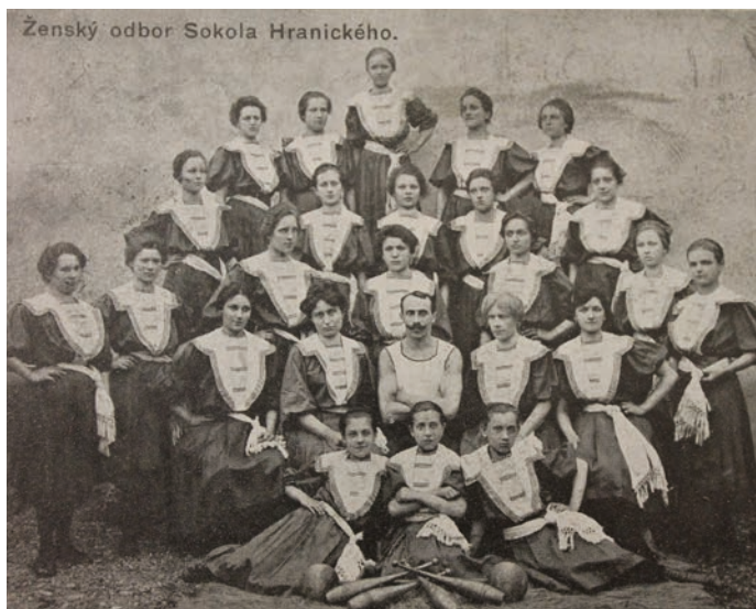
Tepřve v roce 1903 vznikl ženský odbor Sokola, který měl 50 členek a 6 dorostenek.