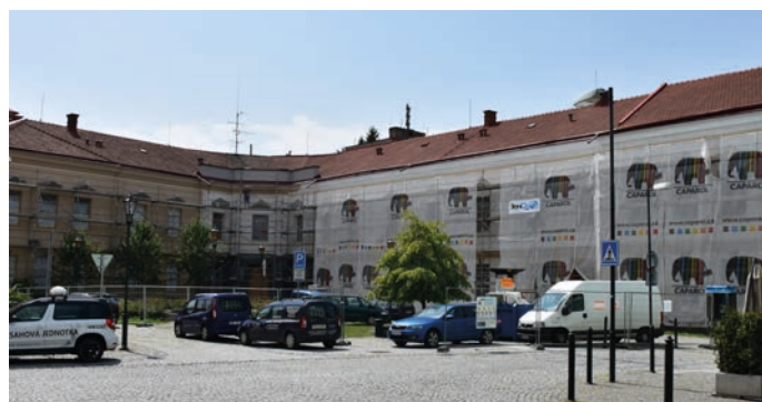
Na aktuální fotografii dostává budova ZUŠ Hranice nový kabát, který respektuje původní historický stav domu a přitom je kultivovaný a souzní s náplní umělecké školy.

Další výraznou změnou doby prochází budova Základní umělecké školy Hranice. Od roku 1789, kdy vyrostla na Školním náměstí, již prošla řadou přestaveb.