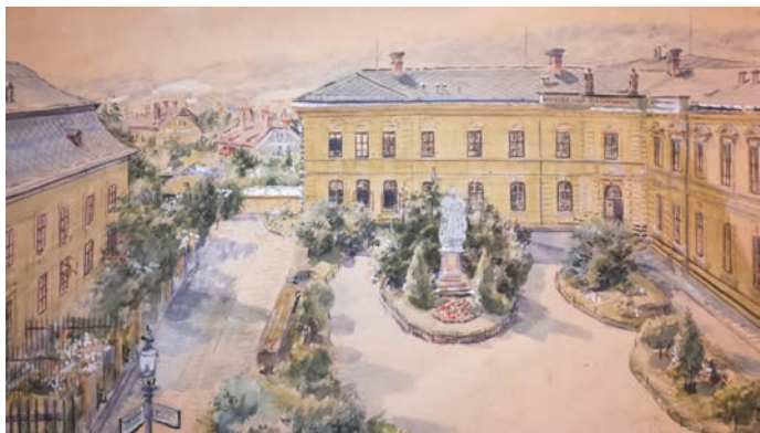
Na akvarelu hranického malíře Jana Pinkavý je zachycená budova Základní umělecké školy na počátku minulého století.