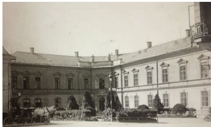
Školní náměstí na fotografii z roku 1920.