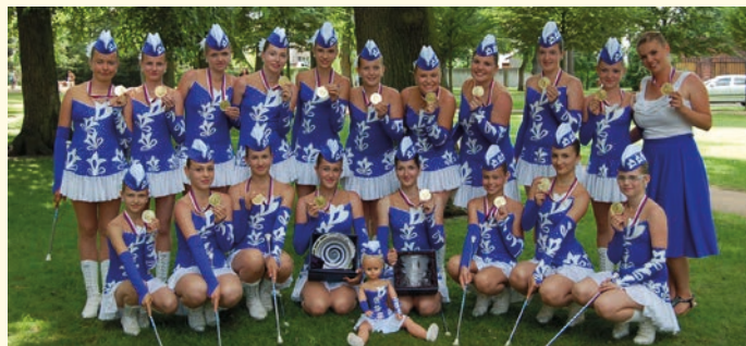
Mažoretky Panenky a Dům dětí a mládeže v Hranicích pořádají nábor nových mažoretek ve věku od 5 let. Nábor bude probíhat po celé září a říjen v hranickém Domě dětí a mládeže na Nové ulici. Bližší informace na www.mazoretkypanenky.estranky.cz . Foto: archiv mažoretek Panenky