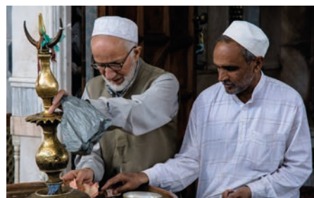
Na besedě s cestovatelem budou k vidění i atraktivní fotografie.

Z Indie do Evropy je název přednášky a besedy cestovatele Pavla Dobrovského, kterou pořádá městská knihovna ve středu 27. září od 18 hodin v Zámeckém klubu.