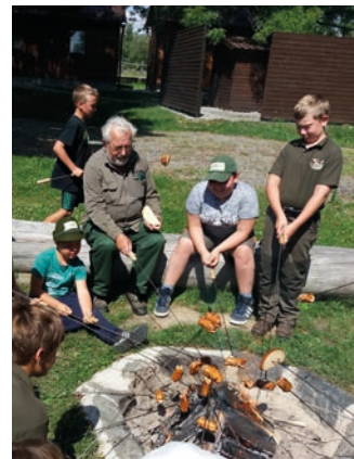
Zážitkem na táboře zaměřeném na myslivost bylo pro děti opékání vuřtů.