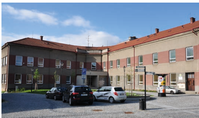
Budova umělecké školy na fotografii z roku 2010.