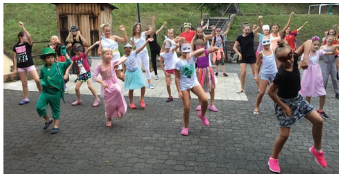
Prázdninové soustředění mažoretek hranického Domu dětí a mládeže probíhalo na Valašsku. Minipanenky a Babypanenky procvičovaly nové prvky s hůlkou i pompony a Panenky trénovaly na Mistrovství Evropy 2017, které se koná v říjnu v Holandsku.