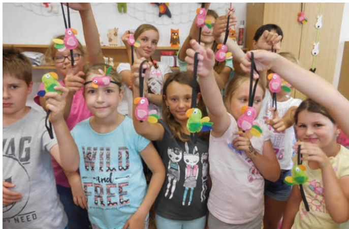
Na příměstských táborech se děti věnovaly také kreativnímu tvoření.

S hranickým Domem dětí a mládeže trávilo prázdniny téměř 430 dětí. „Uspořádali jsme čtyři pobytové tábory, z toho jeden byl v Chorvatsku a také jsme měli soustředění mažoretek. Těchto táborů se účastnilo celkem 154 dětí. Kromě toho jsme měli devět příměstských táborů. Ty byly plně obsazené a bohužel jsme museli odmítat zájemce. Již tradičně je o příměstské tábory obrovský zájem,“ sdělila ředitelka Domu dětí a mládeže v Hranicích Blanka Šturalová. Jak dodala, na příměstských táborech bylo celkem 273 dětí. (red)