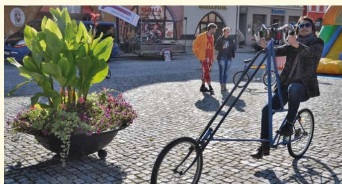
I letos se na Dni bez aut představí netradiční bicykly.

Od 13:00 do 15:30 můžete navštívit i Dětské dopravní hřiště naproti Bille, kde budou jízdy na koloběžkách i kolech a soutěže o drobné ceny. Každé dítě musí mít na jízdu vlastní přilbu. Souběžně bude na Masarykově náměstí probíhat akce Barevný den zaměřená na třídění odpadů. (bak)