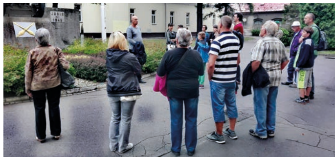
Od června probíhaly prohlídky po areálu vojenských ústavů.

Druhou novinkou letní sezóny byl komentovaný okruh Po stopách hranických židů . Trasa začínala na židovském hřbitově, vedla přes Muzeum na zámku s modelem historického centra