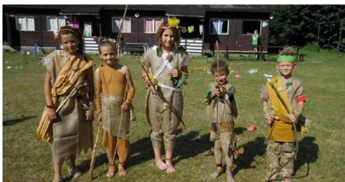
Na tradičním táboře Mraveniště se z táborníků stali pravěcí lidé.