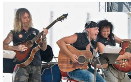
Vladimír Mišík, Peter Lipa, Legends se vrací a další zvukná jména se objeví v Zámeckém klubu.

Od poloviny září se mohou diváci těšit na pravidelné koncerty interpretů různých žánrů v Zámeckém klubu. Sezónu začne ve čtvrtek 21. září koncert předního česko-slovenského zpěváka Petera Lipy, který před čtyřmi lety oslavil sedmdesátiny, avšak na jeho koncertech má člo-