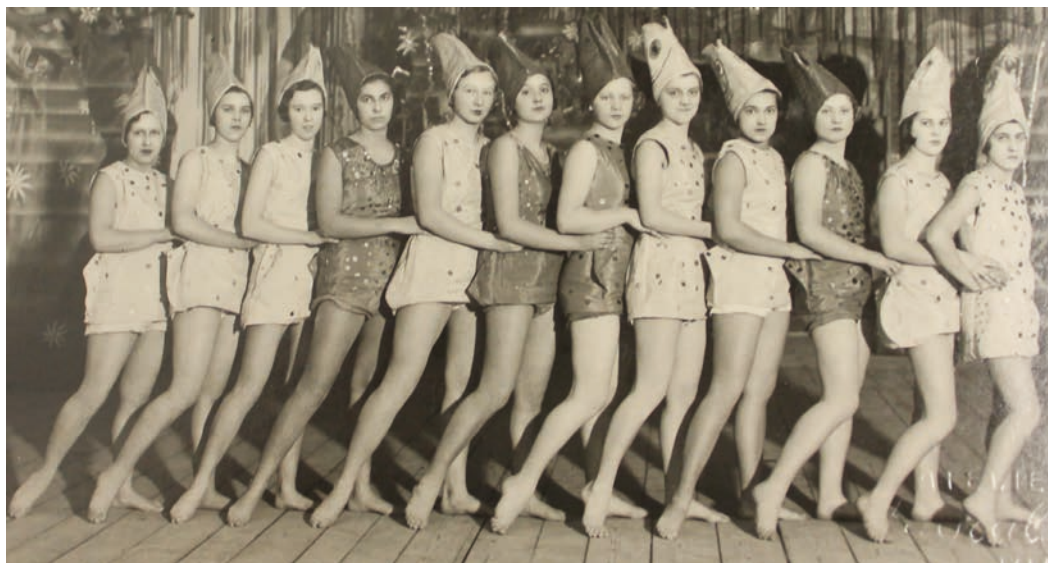
První sokolské šibřinky se konaly v roce 1892. Pro ilustraci jsou na snímku šibřinky z roku 1934 na téma V tajemných hlubinách ocednu. Sokolky v převleku za rybky mají odvážné kostýmy.

Velké zásluhy měli také hraničtí Sokoli na pořádání kulturních akcí ve městě. Věnovali se hlavně ochotnickému divadlu, zásluhy měli také na zřízení veřejné čítárny v Hranicích. Značnou pozornost věnovali i vzdělávací činnosti. Pořádali večírky s přednáškami z oblasti literatury, historie, zdravotnictví, z cest po cizině. Pro dívky orga-