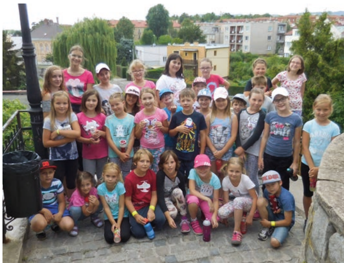
Na táborech nechyběly ani výlety.