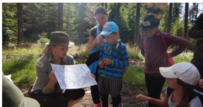
Děti se v rámci lesní výuky dostaly i do vojenského prostoru.