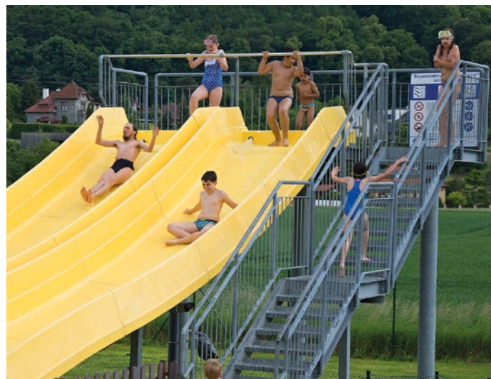
Více než krytý bazén, je v létě samozřejmě využíváno venkovní koupaliště.

Od 1. září zaplatí dospělí za hodinové plavání 80 korun, děti do 6 let mají vstup zdarma. Slevu mají senioři, studenti a mládež od 6 do 15 let, hodina na bazénech je přijde na 60 korun. Nový ceník platný od 1. září najdete na www.aquaparkplovarnahranice.cz .