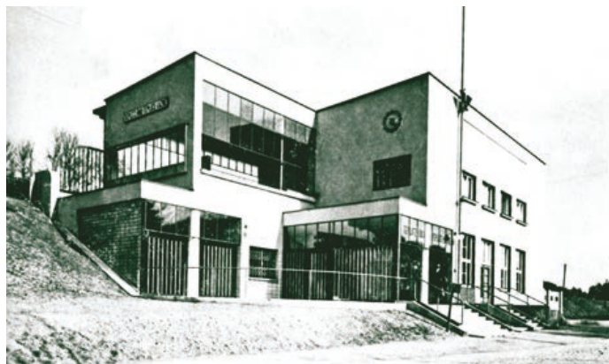
Takto vyhlížela novostavba teplického nádraží v roce 1939.

Nové informační centrum na vlakové zastávce v Teplicích nad Bečvou, zaměřené na Hranickou propast, slavnostně otevře město Hranice v pátek 1. června v 15 hodin.