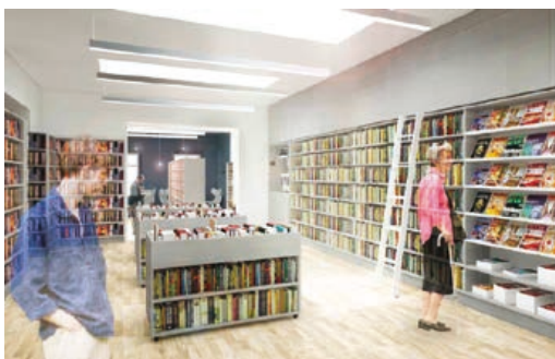
Takto budou vypadat prostory nové knihovny. Regály budou v šedé barvě a u oken bude vytvořen příjemný prostor pro čtení knih. Reprofoto: studie k realizaci knihovny