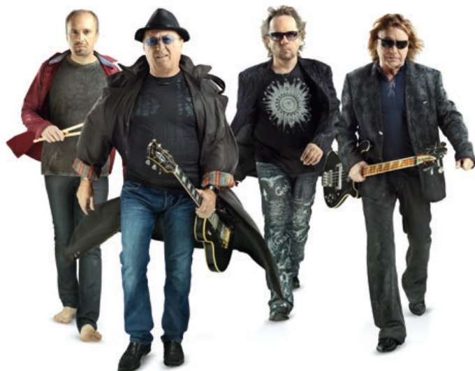
V případě velmi nepříznivého počasí se uskuteční pouze koncert skupiny Olympic a Tanja s kapelou v hranické Sokolovně v časech uvedených na plakátech. Cena vstupenky se nemění.

Jednou z atrakcí je mobilní planetárium. Jde o zábavnou, atraktivní a zážitkovou atrakci pro děti všech věkových kategorií, ale i pro dospělé. Během celého festivalu se v planetáriu budou promítat pořady, které návštěvníky obohatí o zajímavé poznatky z podmořského světa, z vesmíru a mnoho dalších.