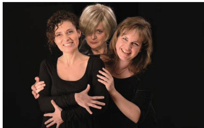
Johann Sebastian Bach trochu jinak je komponovaný pořad slova a hudby o Bachovi s Bachem, kterým posluchače provede herečka Taťjana Medvecká.

Předprodej předplatného se uskuteční od pondělí 10. září do pátku 21. září v pracovní dny od 10 do 12 hodin a od 13 do 16 hodin na Staré radnici v přízemí, v kanceláři Městských kulturních zařízení Hranice (kancelář se sem přestěhovala ze Zámecké ulice). Cena předplatného je tisíc korun. Případné dotazy rádi zodpovíme na telefonu 778 888 053. (red)