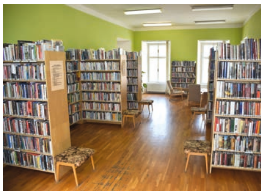
Stávající interiéry knihovny se v létě změní.