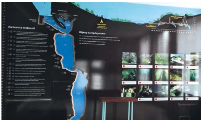
V jedné místnosti nového infocentra je interaktivní model propasti.