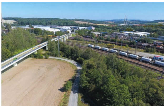
Největší technický problém na trase obchvatu, železniční trať, bude nutné přemostit. Reprofoto

Doprava v Hranicích houstne a ve špičkách se ucpává město. Proudý aut zatěžují obyvatelé města zplodinami, prachem a hlukem.