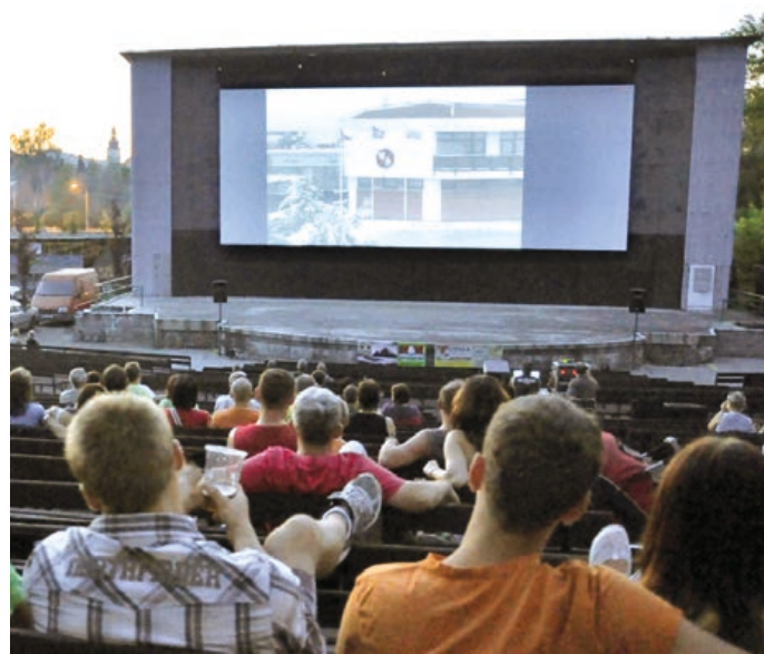
I přes nepříznivé počasí přišlo vloni do letního kina přes 9 tisíc diváků.

Těšit se také můžete na československý film plný tance