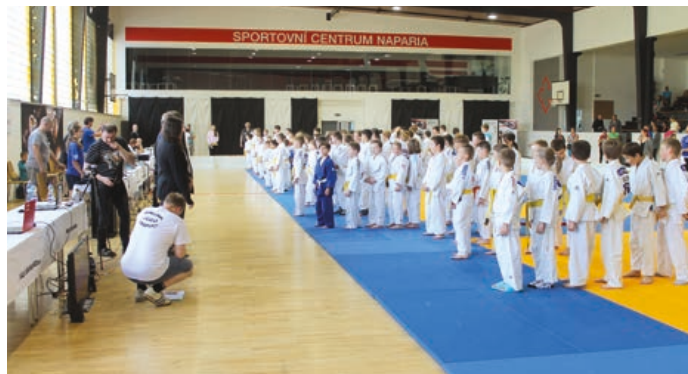
V Hranicích se konal již 24. ročník soutěže pro nejmladší judisty - Memoriál JUDr. Zdeňka Navrátila.

Soutěž mladších žáků (11-12 let) navíc byla Krajským svazem juda Olomouckého kraje vyspána jako jeden z nominačních turnajů bodovaných do krajského žebříčku, na jehož základě se