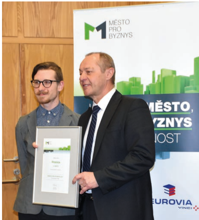
Jedno ze získaných ocenění – Město pro byznys.

posunuli stránky do doby mobility, a to díky responzivnímu designu stránek. U nových stránek je tedy již jedno, zda si je bude uživatel prohlížet v počítači, na tabletu nebo mobilním telefonu – výsledek bude vždy perfektní, a to při zachování zásady jediného zdroje dat, který vede k eliminaci případných chyb.