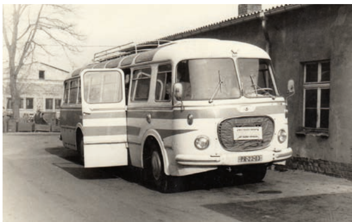
Tento autobus vozil malý dechový orchestr národního podniku Sigma Hranice „Pobečvanka“.