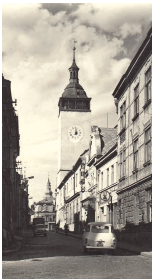
V Radniční ulici se jezdilo oběma směry.