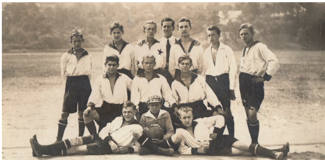
Fotbaloví dorostenci SK Hranice v roce 1922.

Při krátké exkurzi do historie hranického sportu nemůžeme opomenout ani působení našeho nejslavnějšího atleta, čtyřnásob-