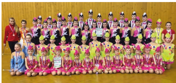
Hranické mažoretky od těch nejmenších po největší.