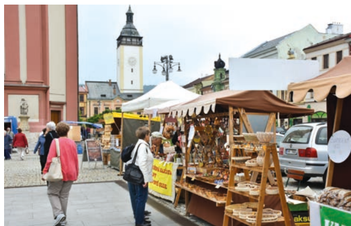
Ke koupi budou i rukodělné výrobky.

Nebude chybět ani občerstvení, například bramboráky, vařená kukuřice či párek v rohlíku. Na akci zve Město Hranice - odbor Obecní živnostenský úřad Městského úřadu Hranice. (bak)