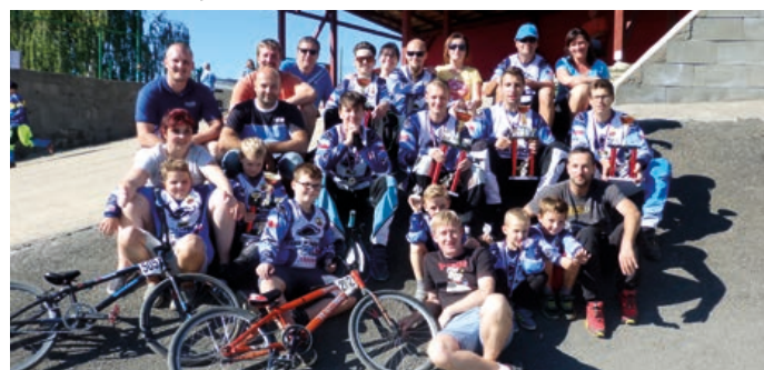
Členové BMX teamu Hranice na posledním závodě sezóny.

Během roku je pro náš tým samozřejmostí péče o areál, řešíme sjízdnost dráhy, údržbu travnatých ploch, běžné opravy, modernizaci zázemí a zabezpečení jezdců na závodech. Stávající dráha však už neodpovídá mezinárodním pravidlům UCI, je zastaralá, nemá startovací za-