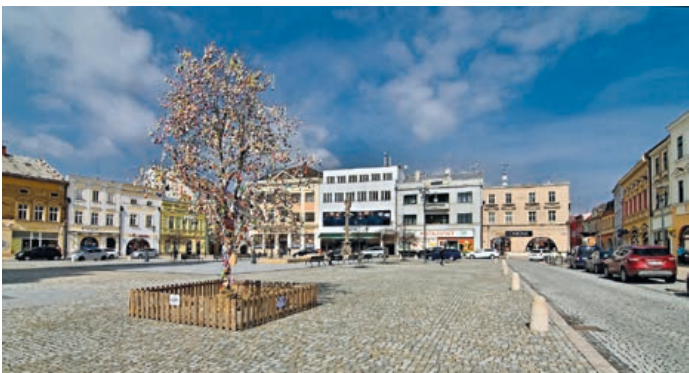
Kraslicovník na Masarykově náměstí.

Atmosféru blížících se svátků jara navozoval po celý duben v centru Hranic opět kraslicovník, tedy strom plný kraslic zdobených různými technikami. Tato milá tradice by nemohla vzniknout bez spolupráce obyvatel města, místních škol, školek, jeslíček, organizací i jednotlivců. Díky nim ozdobilo letošní kraslicov-