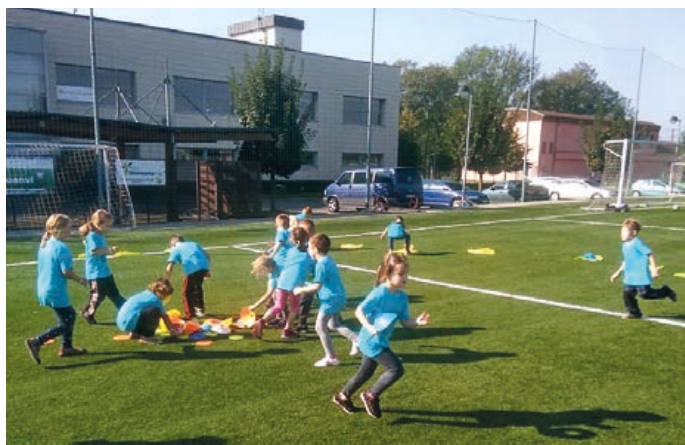
Hranická pohybová školička nejen seznamuje ty nejmenší s míčem, ale věnuje se celkové pohybové zdatnosti.

V žákovských kategoriích jsme schopni konkurovat i li-