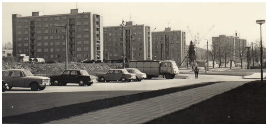
Parkoviště na Třídě 1. máje krátce po výstavbě nových panelových domů.