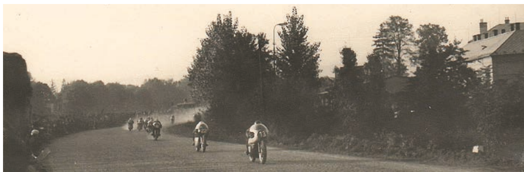
Do historie hranického sportu patří neomyšlitelně i motocyklový závod Hranická osma.

dalším přelomem byl vývoj po roce 1989, kdy došlo k obnovení Sokola a Junáka a mnoha dalším organizačním změnám. Začaly k nám pronikat i nové populární sporty (triathlon, florbal, MTB, šipky, mažoretky).