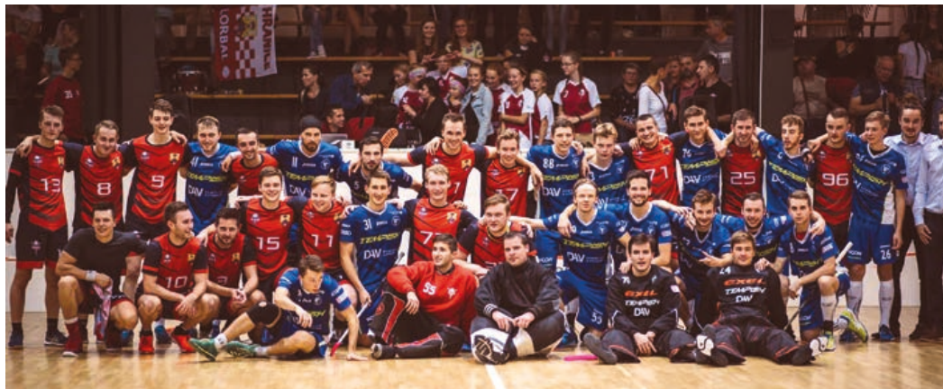
Hraničtí muži slaví postup do Národní ligy.

Mezi úspěchy našeho klubu bych rád vyzdvihl medailová umístění, která vozí z turnajů Olomoucké a Moravskoslezské ligy mladší i starší žákyň. Svou formu potvrdily i 1. místem v celorepublikovém finále základních škol, kde právě tyto dvě kategorie spolu se svými spolužačkami z 6. a 7. tříd ZŠ 1. máje ve finále porazily favorizované hráčky z Florbalové akademie Mladá Boleslav. Díky těmto úspěšným kategoriím