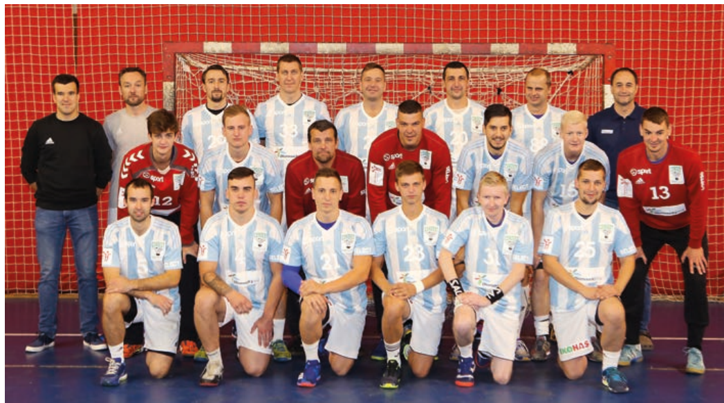
Hraničtí házenkáři na začátku letošního ročníku extraligy.

Pro nastávající soutěžní ročník 2019/2020 je tedy cílem vedení