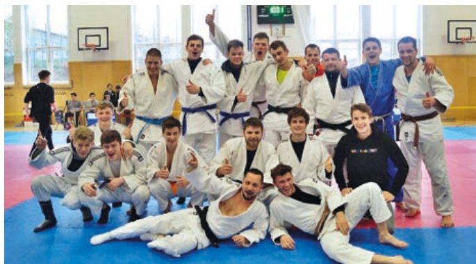
Město Hranice podpořilo také Judo Železo Hranice částkou 100 tisíc korun na nákup tatami.

Kromě toho jsou přidělovány v průběhu kalendářního roku