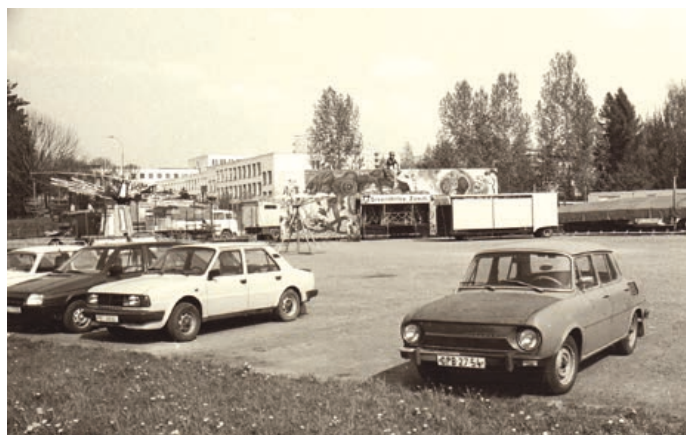
Parkoviště pod školou na Struhlovsku. Dnes v těchto místech stojí parkoviště u Bily. Snímek je z května roku 1994.