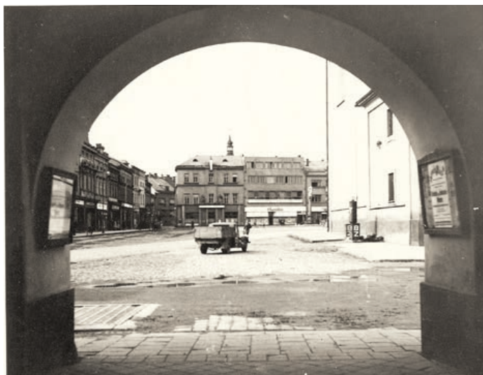
Masarykovo náměstí. S parkováním nebyl problém.