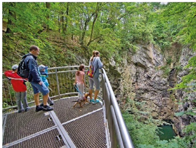
Jedním z turistických lákadel je Hranická propast.

V prostorách infocentra je interaktivní model propasti, který zachycuje nejčerstvější poznatky z výzkumu Propasti. K dispozici jsou také brýle pro zobrazení virtuální reality – pro-