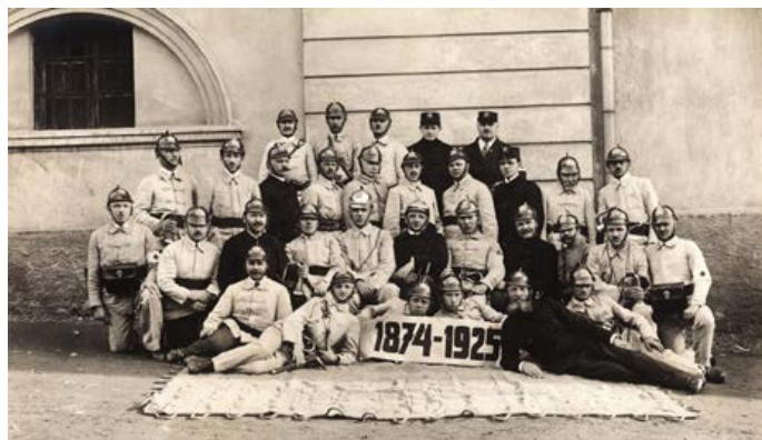
Výstava Fenoném hasičství nabídne i spoustu historických fotografií.