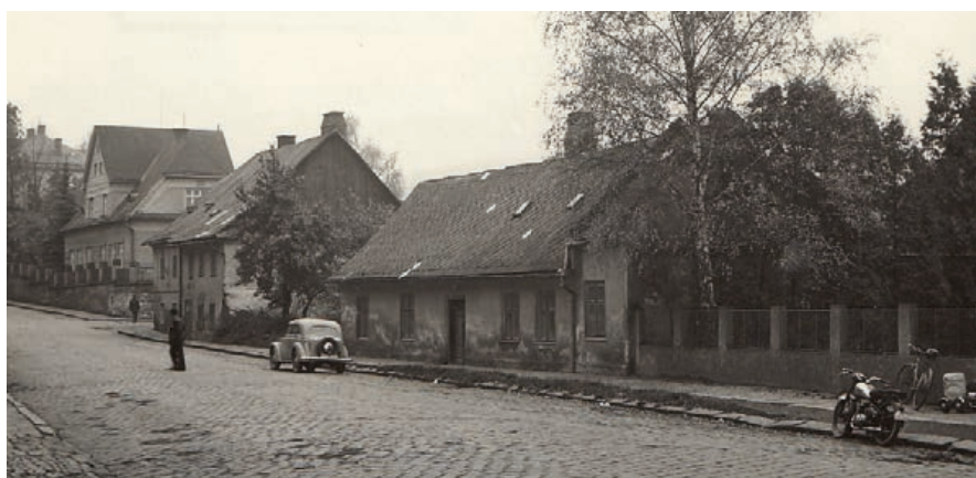
Teplická třída. Žádné kolony...