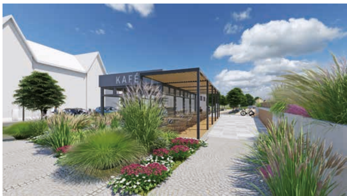
Kavárnička bude poskytovat, jak jinak, výhled na řeku. Vizualizace: Ateliér Kočnar