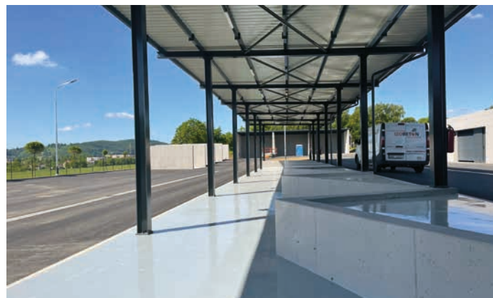
Nový sběrný dvůr společnosti Ekoltes bude od srpna plně sloužit občanům.

nové Ekocentrum, jehož hlavním účelem je separace odpadu.