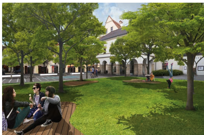
V plánech na úpravu předzámčí je další zeleň a také fontána.