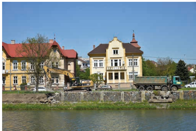
Původní zeď vypadala pevně, realita byla bohužel úplně jiná.