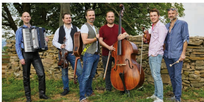
Návštěvníci Hranických slavností se mohou těšit i na kapelu Docuku.