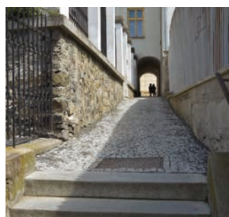
Chodník před synagogou je znovu průchozí.

Město Hranice v květnu opravilo havarijní stav chodníku a poškozené zemní osvětlení v průchodu kolem synagogy. Tento chodník navázal na loni opravené židovské schody. Byly vyměněny i dva poničené schůdky vedoucí k synagoze. Hojně využívaná spojnice Janáčkovy ulice, Masarykova náměstí a centra města s Čechovou ulicí a sídlištěm Kpt. Jaroše je tak po opravách opět průchozí. (bak)