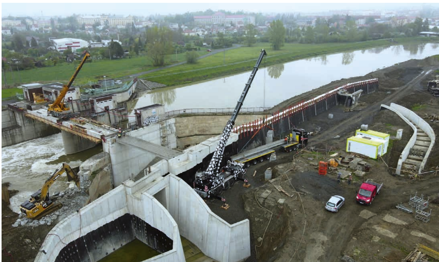
Takto vypadá stavba jezu z výšky.

Celkové předpokládané investiční náklady akce jsou 230 milionů korun. Akce je financována jednak z dotace Ministerstva zemědělství v rámci dotačního titulu Podpora prevence před povodněmi (IV. etapa) a jednak z vlastních finančních zdrojů Povodí Moravy.