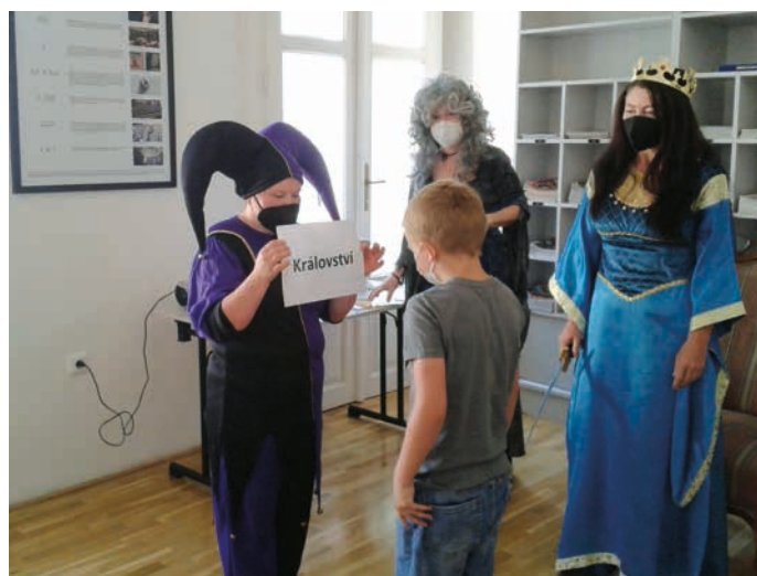
Prvňáčci absolvovali v knihovně ceremoniál pasování na čtenáře.