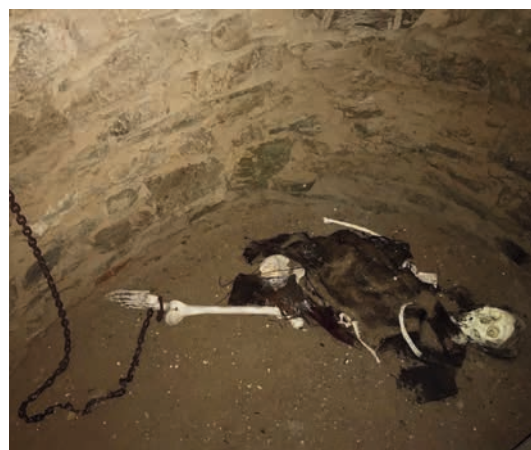
Hladomorna, nebo jen základy bašty?

Na další čtyři zajímavosti, které vám představíme, se můžete těšit v srpnovém vydání Hranického zpravodaje. (ld)