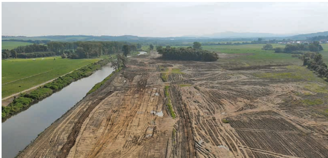
Bečva nad Ústím dostane šanci a prostor vrátit se z rovného koryta k přirozenému tvaru toku.

(bak, s využitím tiskové zprávy Povodí Moravy)