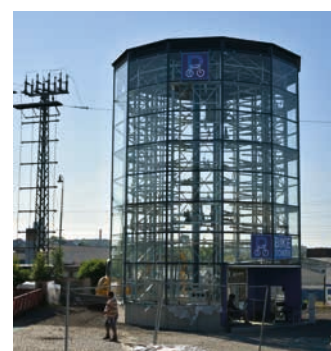
Nová cyklověž se stane dominantou parkoviště.

Cyklověž by měla zvýšit počet osob přijíždějících na kolech k nádraží. V současnosti ale není na nádraží vyřešeno bezpečné parkování kol, což odrazuje množství potenciálních cestujících od volby tohoto druhu přepravy. Očekáváme, že část řidičů, kteří nyní na nádraží jezdí autem,