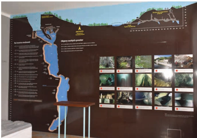
Infocentrum Propast je v bývalé nádražní budově v Teplicích nad Bečvou.