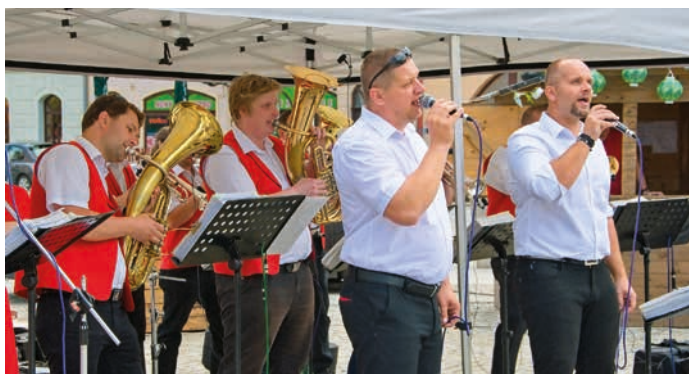
Po celé léto probíhají v centru města „Čtvrťky na námku“, kde se střídají koncerty různých žánrů a zájemci si mohou zahrát obří šachy.