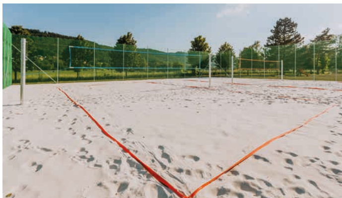
Nové beachvolejbalové hřiště má dva kurty.