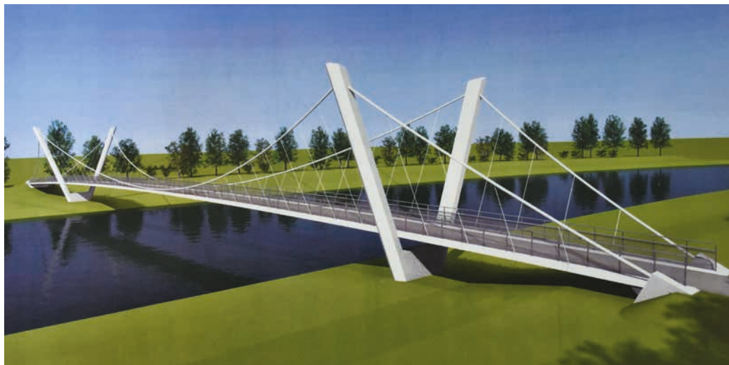
Možná podoba lávky přes Bečvu. Vizualizace: Stráský, Hustý a partneři s. r. o.

Druhá větev odbočí do Černotína. Investor akce je Mikroregion Hranicko a tato cyklostezka vyjde zhruba na 100 milionů