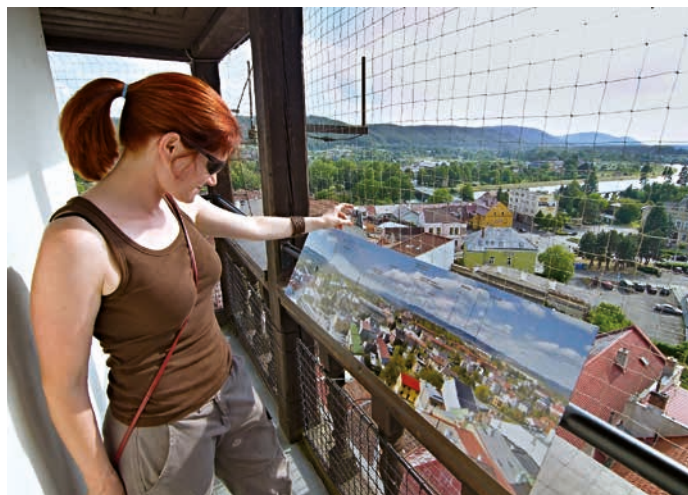
K nejoblíbenějším prohlídkám patří výstupy na věž.

Dalším místem k prohlídce je židovský hřbitov. Toto tajemné a neobvyklé místo můžete navštívit individuálně, klíč od židovského hřbitova je k zapůjčení oproti vratné záloze v Turistickém informačním centru na zámku v Hranicích nebo v Galerii Synagoga. Vstup je zdarma, hradí se pouze vratná záloha za klíč 200 Kč. (tic)