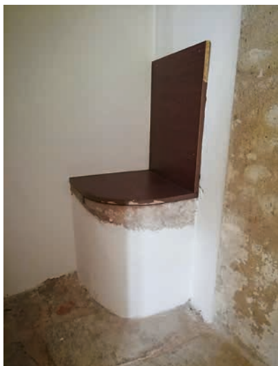
Pozdně gotický převét.