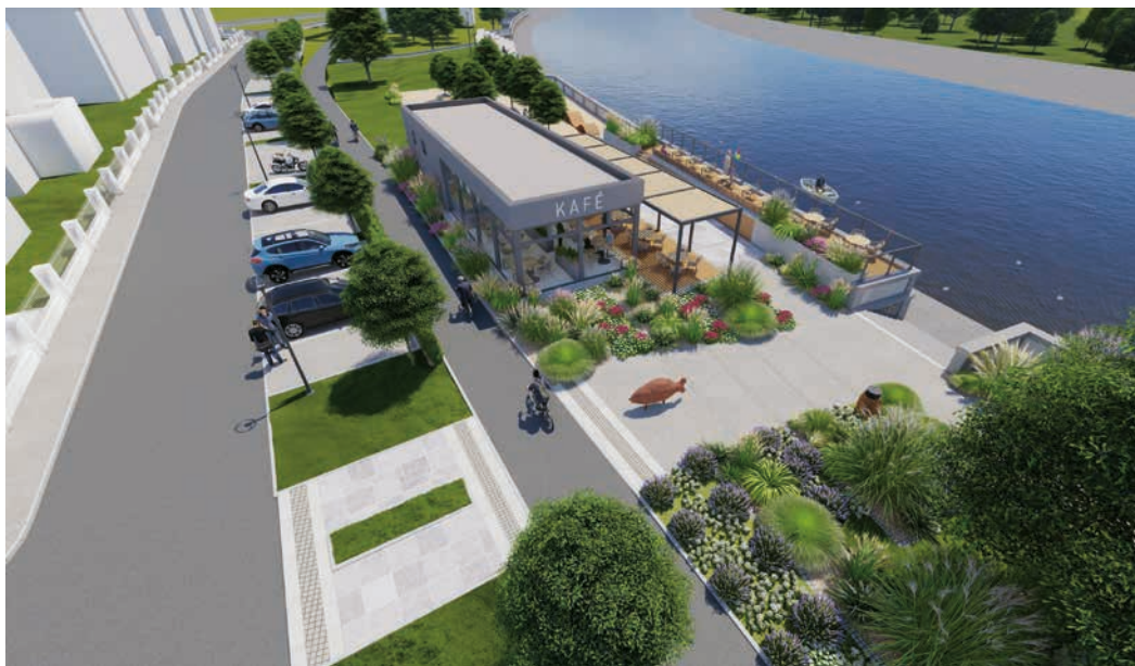
Celá plocha nábreží se promění zásadním způsobem. Vizualizace: Ateliér Kočnar

Další podrobnosti o chystaných úpravách se dozvíte nejlépe na videoprezentacích na webu města www.mesto-hranice.cz nebo na kanálu YouTube Město Hranice.