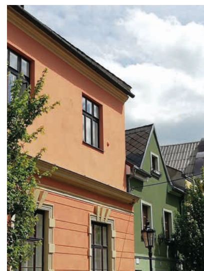
Dělová koule ve zdi Staré radnice.