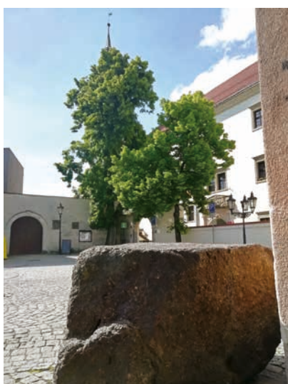
Pranýř byl původně na náměstí.

Další tipy na výlety v Hranicích a okolí najdete na www.mkz-hranice.cz v záložce aktuality