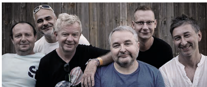
V sobotu 24. července vystoupí v Zámecké zahradě Mňága a Žďorp.

Podrobný program kulturních akcí najdete na www.kultura-hranice.cz .