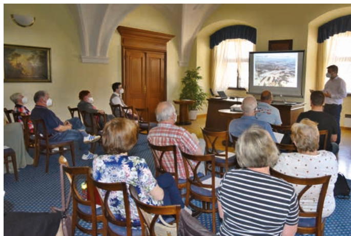
V úvodní prezentaci Povodí Moravy došlo i na ukázky z povodní minulosti.

Petr Chmelař, tiskový mluvčí Povodí Moravy, s. p.