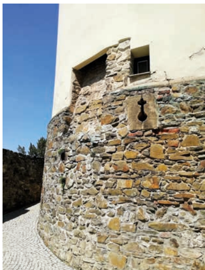
Tudy převét ústil do příkopu.