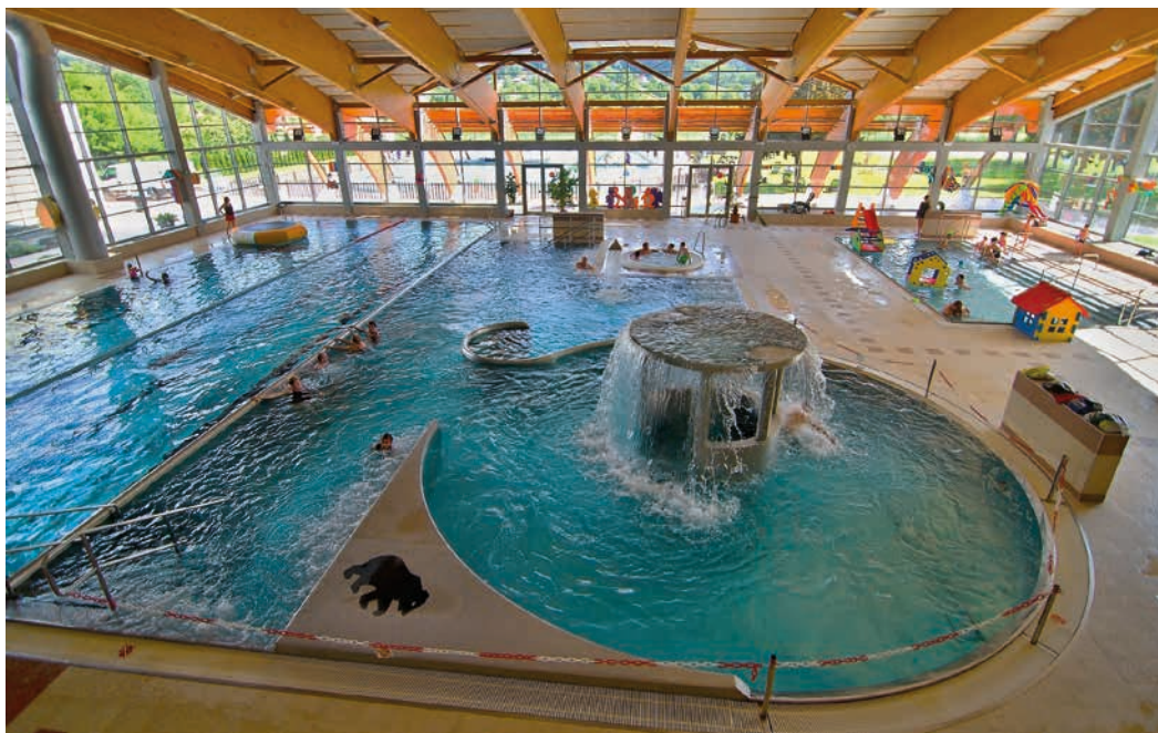
Vnitřní bazén je znovu připraven pro milovníky vodních radovánek.

Tomáš Plesník, vedoucí teplárenského hospodářství a sportovišť Ekoltes Hranice