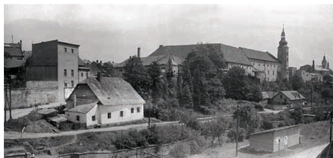
Zámek s hospodářskými budovami v době před požárem.

Bohužel, při realizaci záměru se neobejdeme bez kácení stromů. Ty byly v nedávné minulosti vysazeny zcela náhodně a chaoticky, navíc v druhově nevhodné skladbě. V této souvislosti jsme