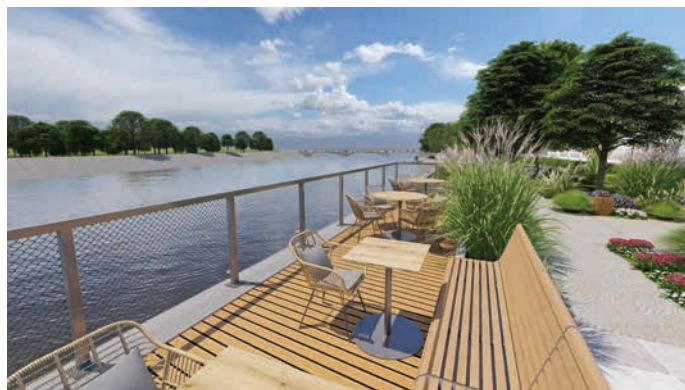
Přístup k řece se pro obyvatele Hranic stane přívětivější. Vizualizace: Ateliér Kočnar