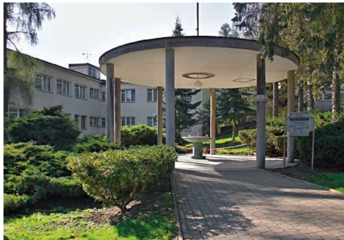
V nedalekých lázních se můžete osvěžit kyselkou.