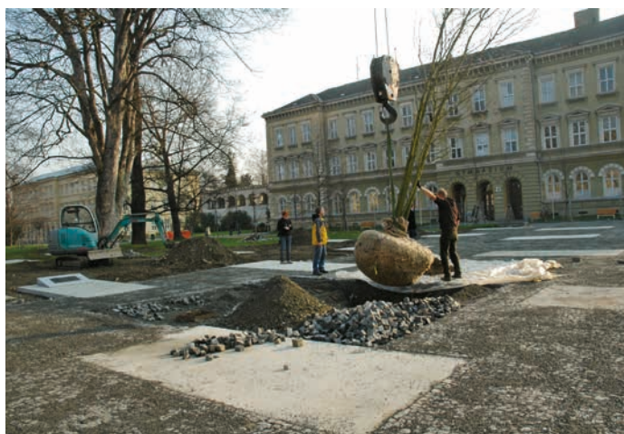
Takto se sázely vzrostlé dřevozce v Krnově.