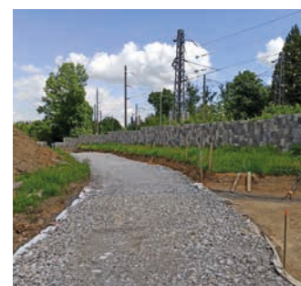
Stavební práce na hřbitově pokračují i letos.

Rekonstrukce hranického hřbitova pokračuje v horní části. Momentálně jsou budovány cesty i inženýrské sítě, jako je voda, elektrika, veřejné osvětlení, a začínají práce na výstavbě kolumbária. Stavební činnost bude pokračovat celý letošní rok a také v roce příštím. Práce se budou postupně přesouvat do dalších částí hřbitova. Celkem se má na hřbitově ještě proinvestovat okolo padesáti milionů korun, a to včetně letošního roku. (bak)