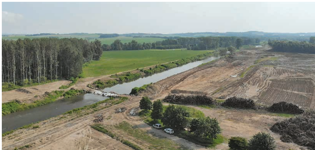
Na fotografii z loňského léta je vidět nepřírozený tvar řeky Bečvy.

Tvarové a materiálové řešení vychází z přirozeného vinutí řeky Bečvy a i po dokončení staveb-