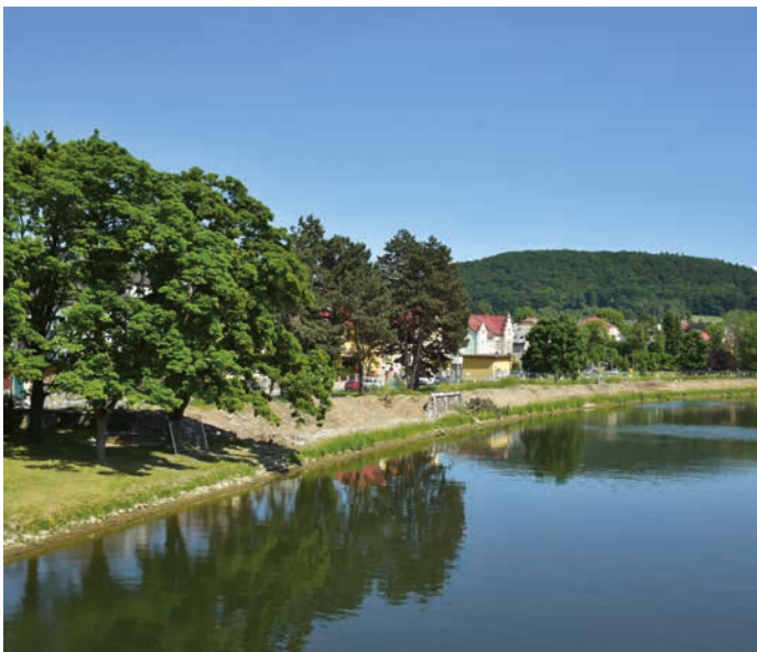
Stará zeď je pryč a s výstavbou nové se začne v červenci.

Zkráceně řečeno, zeď nebyla tak pevná, jak se předpokládalo. Nejenže by neunesla navýšení, ale není ani zaručeno, že by vydržela další velkou vodu, a nebylo by tudíž možné garantovat dlouhodobou životnost. Zeď prosakovala a tím vlastně neplnila svoji funkci. Proto zde bude vybudována zcela nová zeď z pohledového betonu zhruba o stejné výši jako původní zeď včetně zábradlí.