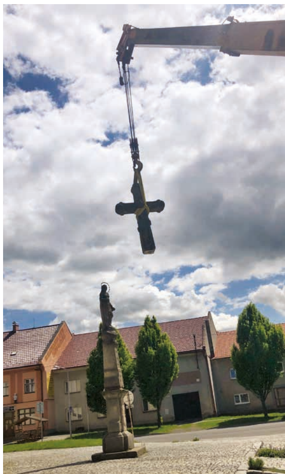
Takto se drahotušský kříž stěhoval k restaurátorům.

Revizi spojovacích čepů nebylo možné provést bez demonstace narušených částí. Kříž byl proto demonstván a odvezen do restaurátorské dílny, kde je nyní opravován základ kříže. Probíhá také lepení a tmelení trhlin, biosanace kamene, prekonsolidace, očištění od černých depozitů a nevhodných oprav a bude provedena revize čepů a barevná retuše. Na své původní místo bude kříž navrácen v září. Cena opravy činí téměř 118 tisíc korun a Olomoucký kraj pomohl 45 tisíci korun.