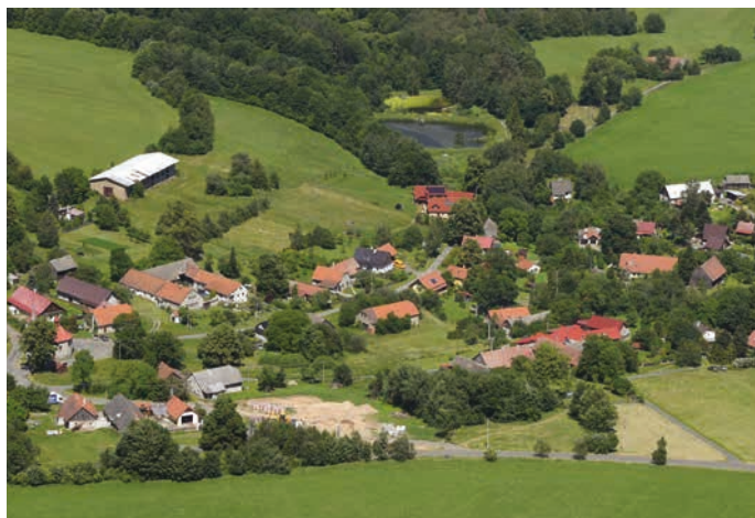
Středolesí z ptáčích perspektiv.