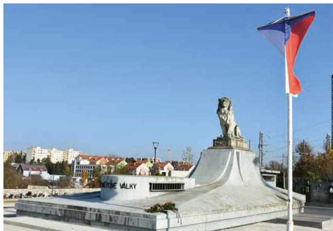
Lev na vrcholu mauzolea potřebuje opravu.

V příštích letech by se měla uskutečnit také úprava Šromotova náměstí , proto v letošním roce začínáme připravovat studii tohoto prostoru.