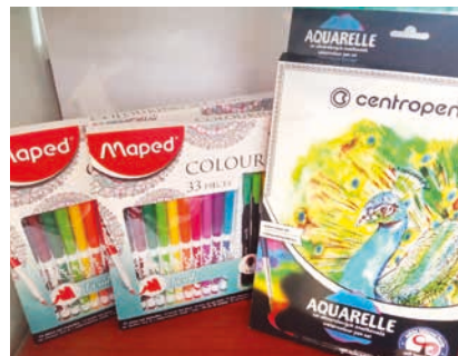
Výherní ceny do soutěže věnovala firma Astra Office.