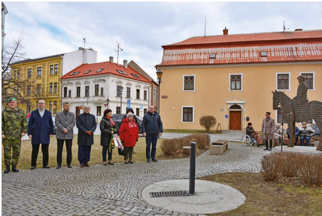
Shromáždění k oslavám narození T. G. Masaryka.