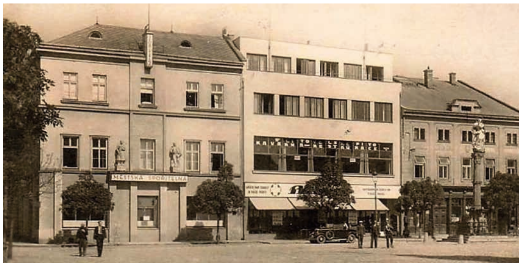
Dům čp. 121 po přestavbě již s prodejnou obuvi firmy Baťa.