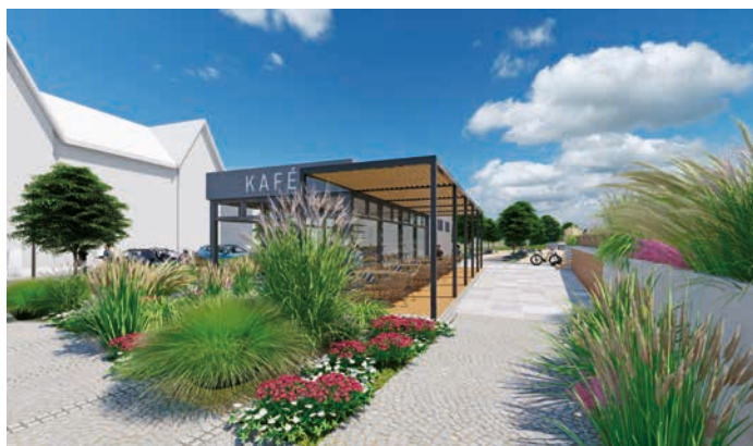
Vizualizace Kropáčovy ulice podle návrhu studia Atelier Kočnar.