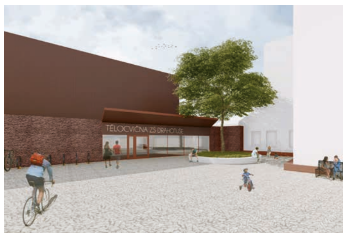
Vizualizace venkovního prostoru před tělocvičnou. Vizual: Tereza Růžicková