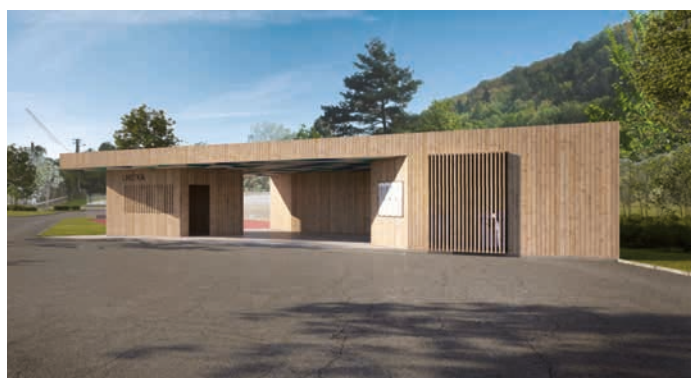
Budoucí podoba autobusové zastávky ve Lhotce.