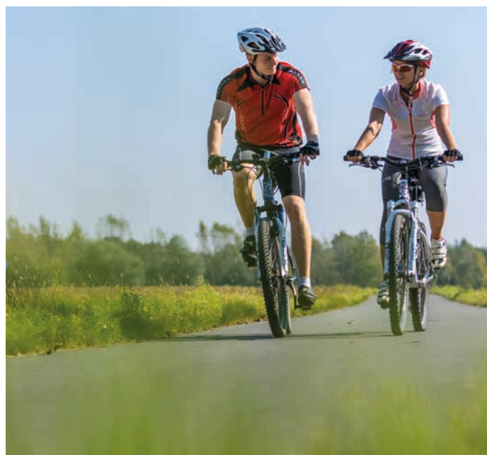
Když vyrazíte od pramene Rožnovské Bečvy do Valašského Meziříčí, cestu si můžete ozvláštnit několika naučnými stezkami nebo zdolat několik rozhleden.

Z Rožnova pod Radhoštěm cyklostezka vede směrem na Va-