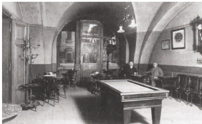
Interiér hostince Beseda ve 20. letech 20. století. Zdroj: Bohumír Indra: Historie hranických domů