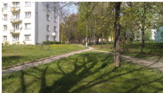
Vizualizace další etapy Struhlovsko (nahore – úprava chodníků a vybavení venkovním mobiliářem a cvičebními prvky, dole – současný stav).