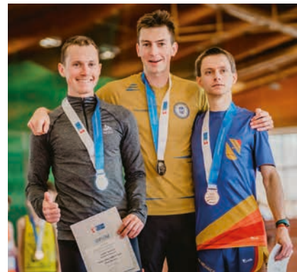
Rostislav Kolář na stupních vítězů.

Na první pohled se dá říct, že jsem dosáhl maxima možného. Těžko mohu v amatérských podmínkách bez odpovídající regenerace soutěžit s olympio-