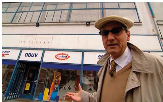
Prodejna obuvi v roce 2002 ve filmu Šumné Hranice.