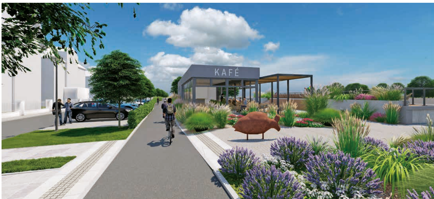
Vizualizace možné podoby cyklostezky v úseku Kropáčovy ulice.