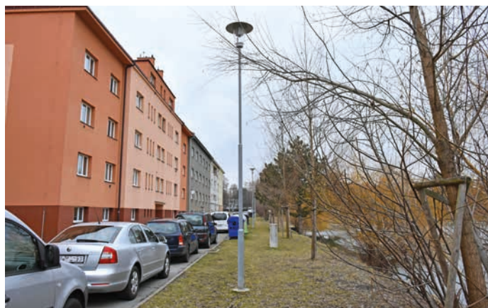
Auta budou nově stát kolmo k ulici.