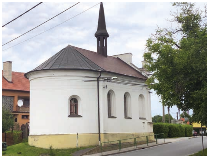
Kaple ve Velké dostane novou fasádu.