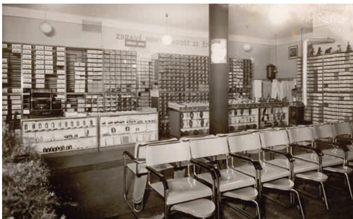
Interiér prodejny Bata.