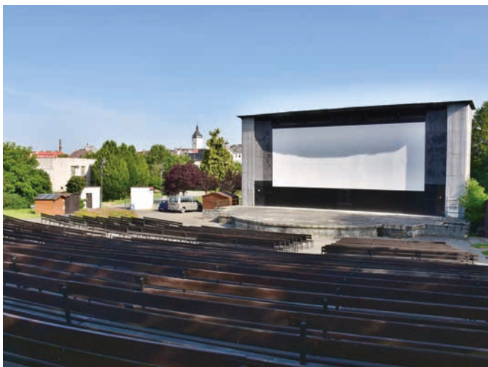
Letní kino čeká oprava za 7 milionů korun.