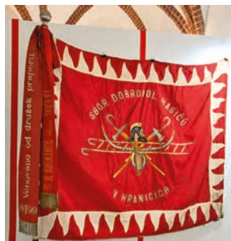
Hasičský prapor hranického sboru.