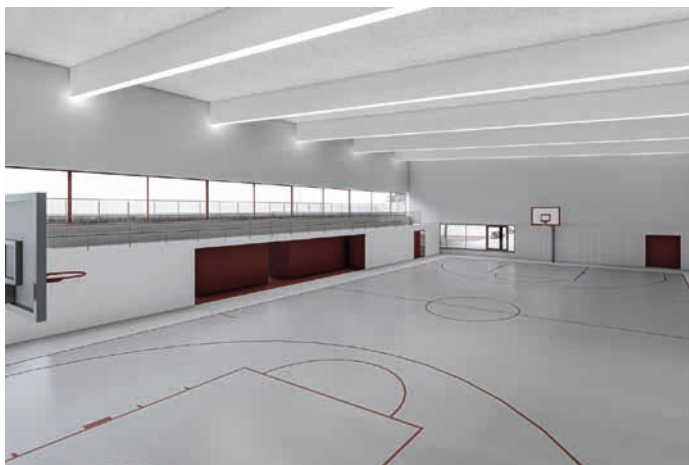
Návrh interiéru školní tělocvičny v Drahotuších. Vizual: Tereza Růžicková

Velkou akcí bude také hospodaření s dešťovou vodou na ZŠ a MŠ Šromotovo , kdy by měly být vybudovány retenční nádrže na zachycení a další využití vody, která naprší na střechy. Tento projekt by měl stát 11 milionů korun, počítáme s ním ale pouze při získání dotace.