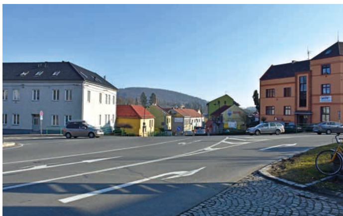
Tato křižovatka není bezpečná.

ní protipovodňových opatření povede až k mostu přes Bečvu v ulici Mostní. Na tuto cyklostezku máme již vydáno stavební povolení.