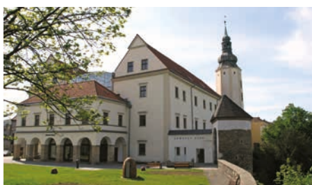
V průběhu akce bude uzavřen tento vstup do Zámecké zahrady.