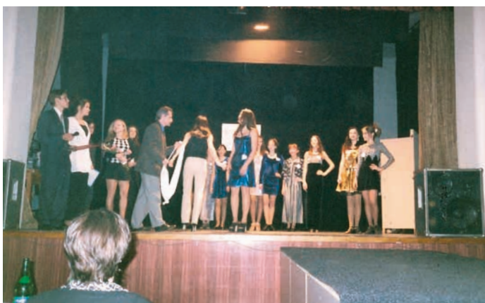
Interiér Besedy v 90. letech při příležitosti soutěže Miss poupě/dívka Hranice.