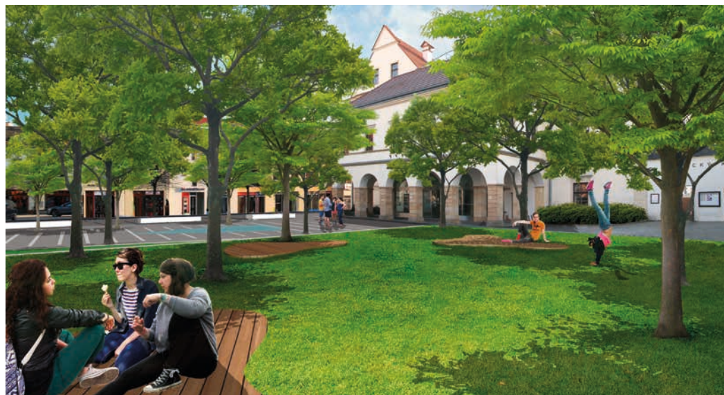
Předpokládaná podoba předzámčí ve vizualizaci Ateliéru Zahrada.