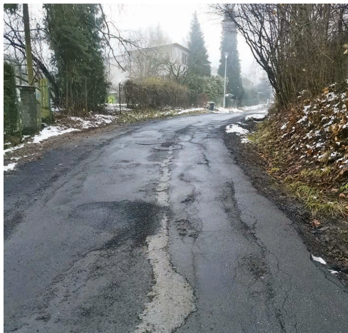
Stav ulice Pod Bílým kamenem je opravdu neudržitelný.

Pro cyklisty připravujeme tři cyklostezky – jednak cyklostezka Římský most – Tovární, která naváže na loni otevřenou cyklostezku z Běloutína, dále cyklostezka v ulici Žáčkova, která propojí sportovní areál s cyklostezkou Bečva směrem k Rybářům a zpří-