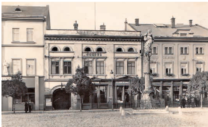
Beseda za první republiky ještě před přestavbou. V přízemí se nacházel průjezd na dvůr a vpravo restaurace s kavárnou.