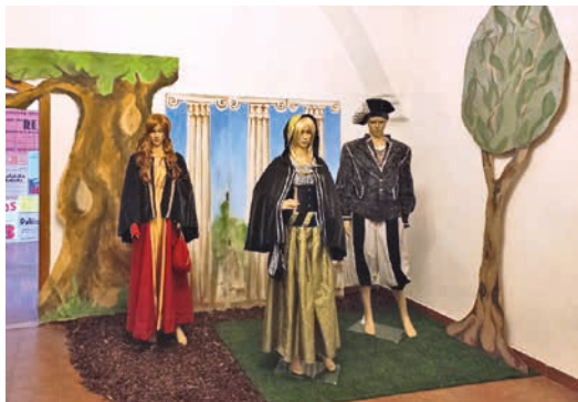
Nechybí divadelní kostýmy a kulisy.

Na Staré radnici v Hranicích je Divadlo. Tedy výstava, která připomíná, že před osmdesáti lety proběhlo první představení profesionálního hranického divadla. Jmenovalo se Beskydské di-