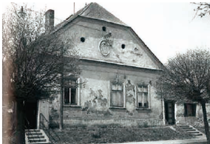
Průčelí hlavní budovy Horního dvora s oválným znakem Dietrichštejnů v roce 1968.

Během řádění švédského vojska ve městě roku 1643 byl Horní dvůr značně pobořen a mlýn s pilou spáleny, studna ve dvoře zasypána. Avšak do konce téhož století byly hospodářské i obytné budovy nově vybudovány. Z toho důvodu byl na štítě hlavní obytné budovy šafáře umístěn v omítce oválný znak knížat z Dietrichštejna, který zde vydržel až do zboření dvora. V polovině 18. století byly objekty dvora rozšířeny a na paměť toho byl do budovy vsazen kamenný kvádr se znakem Dietrichštejnů s letopočtem 1751. Tato pamětní deska