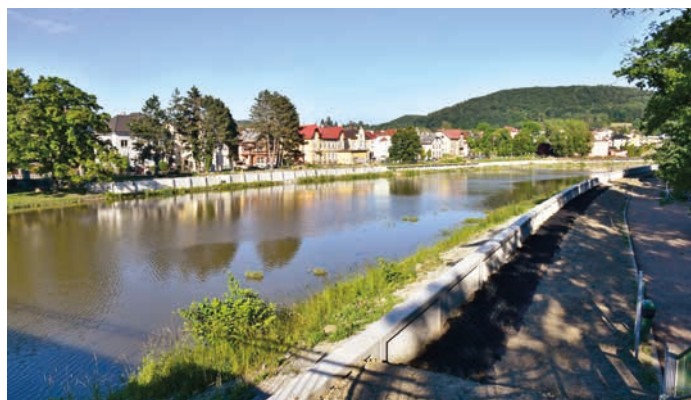
Nové ohrázování.

A na cyklostezku plynule naváže také revitalizace nábřeží Kropáčova, na které se již připravuje projektová dokumentace na základě vypracované studie architekta Tomáše Kočnara, který se svými spolupracovníky přišel s návrhem zapojení nábřeží, jakožto jedinečného městského prvku, do urbanistické struktury Hranic, ve vazbě na oddychovou zónu v přírodním pásmu podél řeky ve směru k lázním Teplice nad Bečvou.