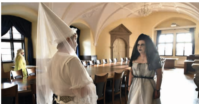
Prohlídky hranického zámku oživila vystoupení herců z divadelního souboru Tyl Drahotuše.