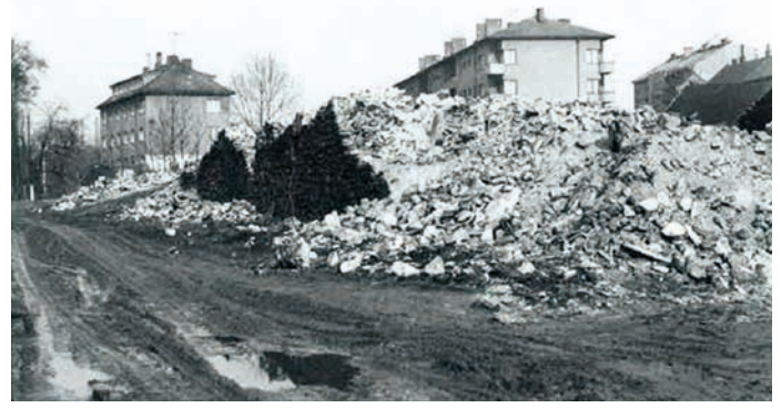
Pohled z dnešní Bezručovy ulice na ruiny dvora, v pozadí opět dům čp. 1279–1281.