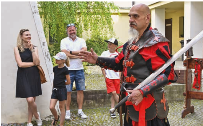
Hranická muzejní noc se uskutečnila v pátek 20. května. Na Staré radnici měl kat mučící nástroje, a kdo chtěl, mohl si je vyzkoušet.