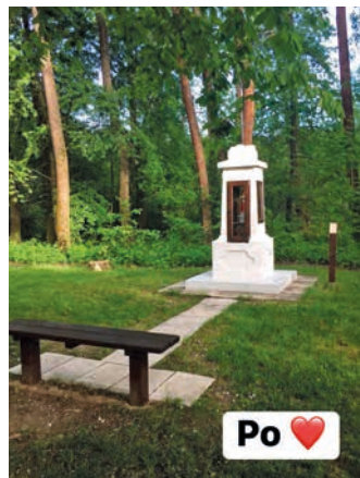
Proměna památního místa na Rybářích.