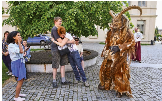
Hrůzostrašný krampus se v tento den pohyboval po městě. Neodvážil se jen do kostela. Více fotek na muzeum-hranice.cz/fotoreportaz-z-hranicke-muzejni-noci/