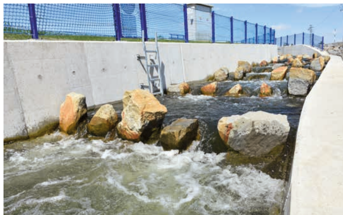
Rybí přechod je v Hranicích novinkou.

ní v podobě tribun, které navíc umožní přístup až přímo k řece. Opatření tak na jednu stranu budou obyvatele chránit před povodněmi, ale současně učiní řeku pro lidi snáz dostupnou.