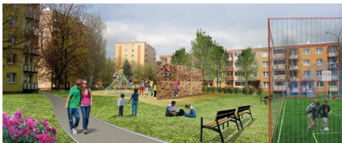
Vizualizace budoucí podoby sídliště Struhlovsko. Vizualizace: Ing. arch Radmila Vraníková, Ph.D. – A studio Kroměříž