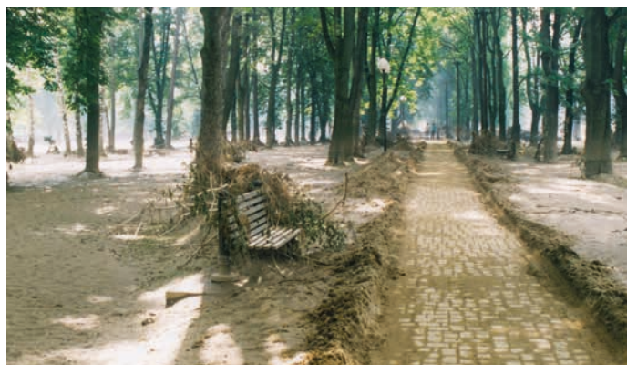
Následky povodní v Sadech Čs. legií.