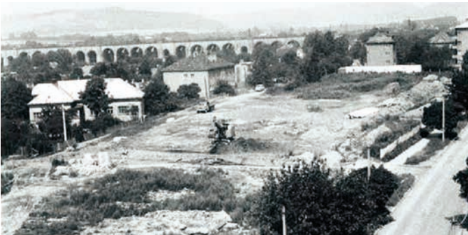
Vzniklé prostranství na místě Horního dvora mezi Hálkovou a Máchovou ulicí v roce 1974. Domek vlevo je Číhalova pila, která v přestavěné podobě stojí dodnes.