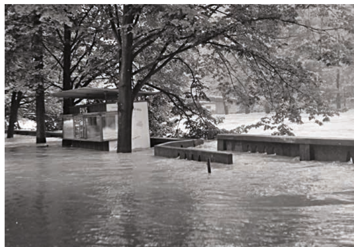
Takto zpusťovala velká voda lázeňskou kolonádu v roce 1970.

2. Při využití předpouštění zajišťuje prakticky stejnou protipovodňovou ochranu jako suchý poldr. Navíc je možno retenční prostor nádrže využít pro redukci i menších povodní, při kterých je zaplavováno vnitřní lázeňské území Teplíc a další území s chatami v zahrádkářské oblasti u Bečvy, které mají menší ochranu než město Hranice.