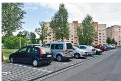
Nové parkoviště již lemuje ulici Jiřího z Poděbrad.

Město dlouhodobě usiluje o posílení počtu parkovacích míst. Loni tak vzniklo nové parkoviště na Struhlovsku poblíž restaurace Kotelna, rok předtím jsme ve spolupráci se společností EkoPrima Fin otevřeli záchranné parkoviště v Komenského ulici poblíž hotelu Centrum pro 29 aut. Parkoviště se nachází necelých 300 metrů od Masarykova náměs-