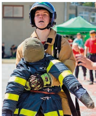
Hasičské soutěžení bylo letos opravdu tvrdé.