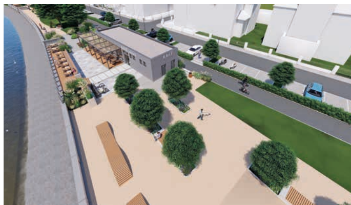
Budoucí podoba nábřeží v Kropáčově ulici. Vizualizace: Ateliér Kočnar