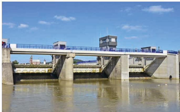
Jez se o třetinu rozšířil.

Na obou březích nad mostem vznikají v celkové délce 700 metrů nové protipovodňové zdičky a hrázování. Jejich příprava probíhá ve spolupráci s městem a památkáři tak, aby zůstal zachován půvab ulice Kropáčova. Na pravém břehu řeky vznikne replika původní stávající zdi, která bude obložena kamenem a doplněná o zábradlí. Součástí protipovodňových opatření bude volnočasové pásmo. Tomu budou dominovat dvě poseze-