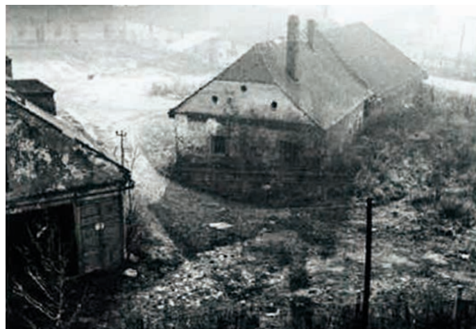
Pohled na zchátralý areál Horního dvora směrem ke Kunzově vile v roce 1971.