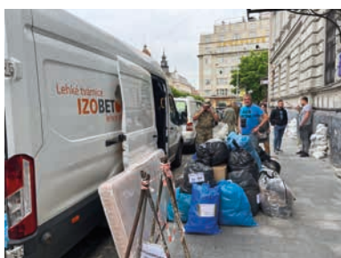
Vykládka pomoci přivezené z Hranic na Ukrajinu.

kteřá jsou přeplněna uprchlíky a již nemají prostředky na jejich zabezpečení. Celem se v době uzávěrky tohoto čísla uskutečnily tři jízdy dvojice dodávek, které dovezly pomoc do měst Lvov, Turka a Krakova. Dopravu zajistila firma Strojeaustavby Tvrdouš s. r. o., za což děkujeme jak jí, tak i dobrovolníkům zabezpečujícím přepravu. (bak)