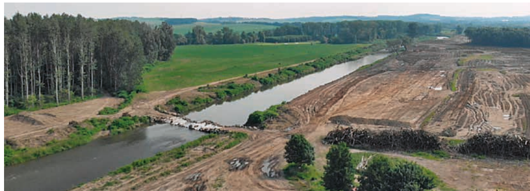
Nepřirozeně rovné řece terénní úpravy jenom prospějí.

Proti plánům na stavbu vodní nádrže se před časem zvedla