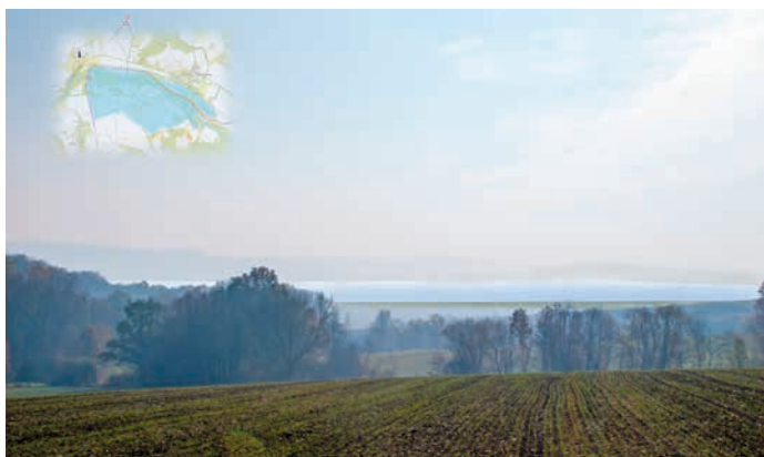
V této lokalitě by mělo být vybudováno vodní dílo Skalička.

Vodní dílo Skalička je součástí souboru protipovodňových opatření, která mají být na Bečvě postupně budována až k obci Troubky u Přerova. „Tento soubor opatření se bude v aktuálních cenách pohybovat kolem šesti miliard korun, z toho vybraná varianta vodního díla Skalička, tedy boční suchý poldr, bude představovat čtyři až 4,5 miliardy korun,“ uvedl Nekula.