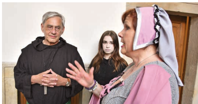
Davy zájemců si nenechaly ujít strašidelný zámek. Noční prohlídky nabízely návštěvu hladomorny i výstup na zámeckou věž. A to za asistence historických postav.