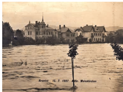
Bečva vždy jednou za čas ukázala svoji sílu – povodně v roce 1907.

„Ukazuje se, že společná řeč rezortů životního prostředí a zemědělství se příznivě promítá do české krajiny. U Skaličky jsme se dokázali dohodnout na variantě suchého poldru, který plní funkci ochrany před povodní a zároveň nebude nijak zásadně zasahovat do přírodních podmínek tohoto místa, to je win-win