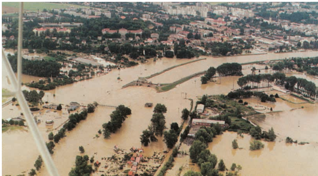
Hranický jez na Bečvě.

Povodeň postihla území v povodích řek Morava (Bečva), Odry a horní Labe a měla neočekávaně rychlý a dravý průběh s obrovskou ničivou silou, kdy na horních tocích došlo k téměř totální devastaci koryt vodních toků. Vy-