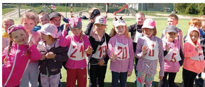
Nadšení mladí atleti.

Další disciplínu v hodu míčkem nejlépe odházela Tereza S. z mateřské školy Míček a za chlapce s krásnými 15,5 m Maximilián P. z Teplic.