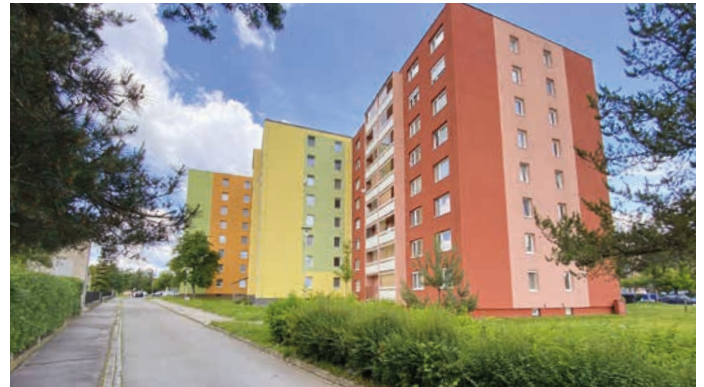
Pohled z Bezručovy ulice dnes.

byla při demolici budov vyřata a uložena v lapidáriu městského muzea.