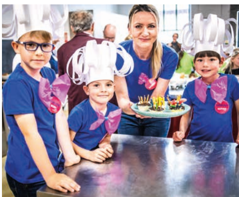
Tým MINichefové se probojoval do celorepublikového finále.