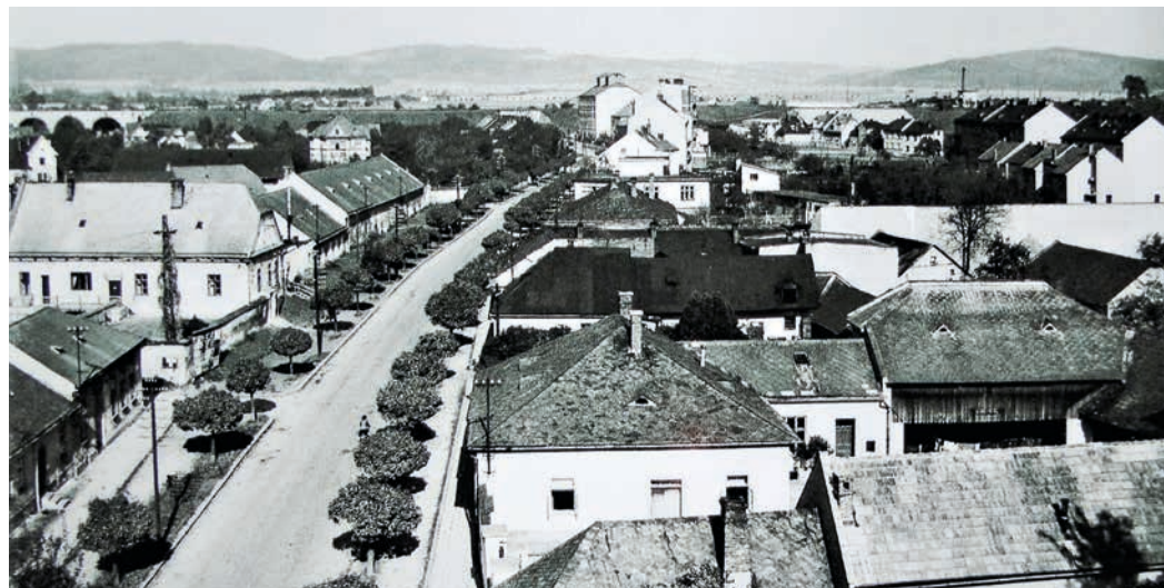
Pohled z Kunzovy věže na Třidu 1. máje směrem k viaduktům. Po levé straně se rozprostírají objekty Horního dvora, které se táhly až k bývalé restauraci Slávia.

Horní dvůr získal své jméno až v roce 1622, tedy přesně před 400 lety, kdy po nevydařeném stavovském povstání připadlo hranické panství kardinálu Dietrichštejnovi poté, co bylo