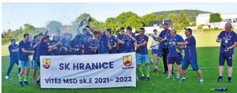
Hraničtí fotbalisté po vítězném „postupovém“ utkání.