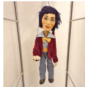
Na výstavě je k vidění i loutka Karla Gotta.

vadlo. Výstava mapuje divadla a ochotnickou činnost v Hranicích. Těšit se můžete na divadelní kostýmy, rekvizity, kulisy, masky a další předměty vztahující se k divadlu. K vidění bude také spousta loutek ze známých pohádek. Připraven je i doprovodný program, například si návštěvníci budou moci vyrobit vlastní loutky. Výstavu můžete navštívit od čtvrtka 30. června, kdy v 17 hodin výstava odstartuje vernisáží, až do neděle 2. října. (red)