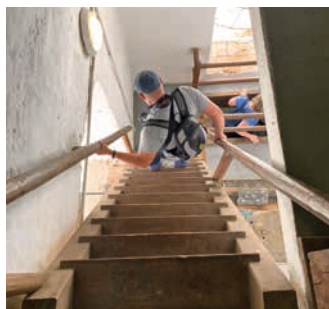
Výstup na věž obnáší zdolání spousty schodů.