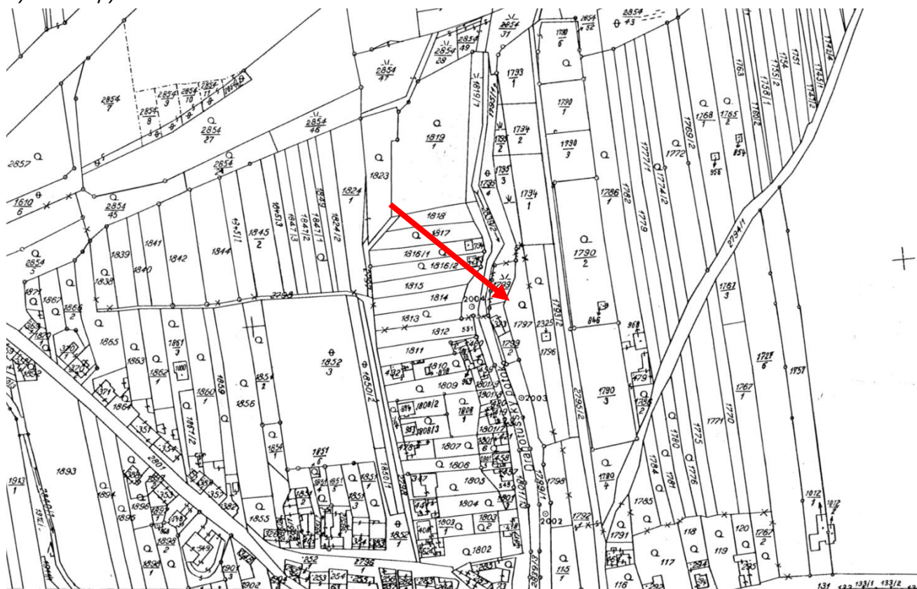
Výřez z mapy evidence nemovitostí z roku 1966