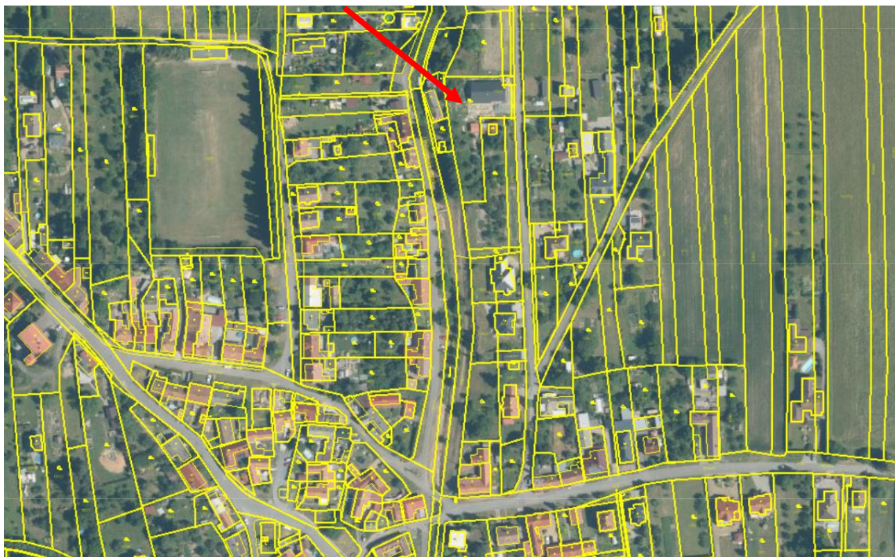
Výřez z katastru nemovitostí s ortofotomapou se stavbou rodinného domu na pozemku p.č. 1797/1.

Navržené řešení je tedy přijatelné i z hlediska ochrany zemědělského půdního fondu.