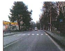
3) v extravilánu za obcí Hranice u vlakové stanice Tuplice nad Bečvou na silnici č. I/35