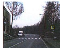
4) 2x v obci Osek nad Bečvou na silnici č. I/47