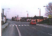
5) v obci Kokoryn na silnici č. I/55

Č.j.: KUOK 11549/2014 Sp.zn: KÚOK/10522/2014/ODSH-SH/490