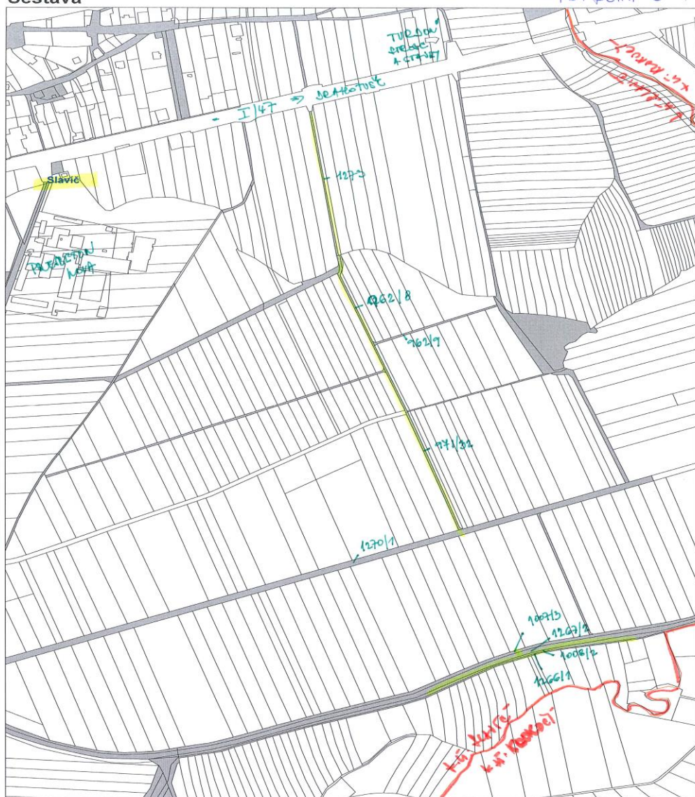
Mapa v měřítku 1:6000