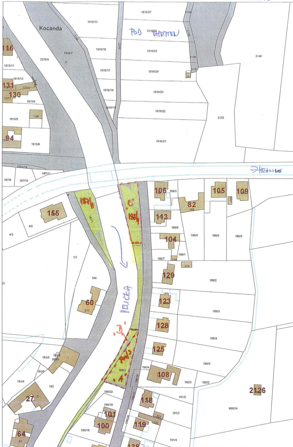
Mapa v měřítku 1:1500