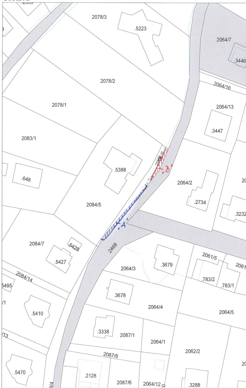
Mapa v měřítku 1:750