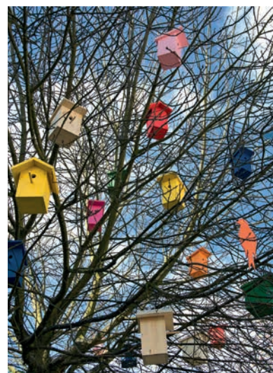
Budkovník si oblíbili nejen lidé, ale i ptáci.

Máte-li i vy zájem aktivně se zúčastnit Velikonočních farmář-