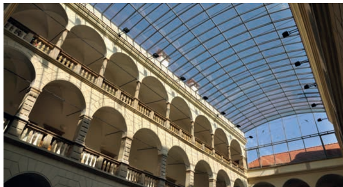
Jednou z plánovaných investic je oprava zastřešení dvorany zámku.

Město chystá na letošní rok i další významné projekty, ať už v dopravní infrastruktuře, škol-