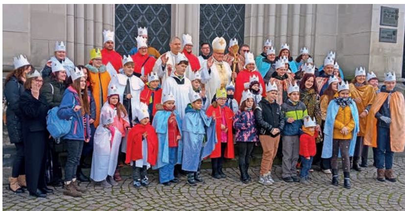
Koledníkům se podařilo vybrat rekordní částku.

Každý rok z prostředků získaných z Tříkrálové sbírky pomáháme rodinám s dětmi s postižením, osamělým rodičům, rodinám s více dětmi, opuštěným seniorům a lidem, kteří se ocitli v krizové situaci. Část výtěžku věnujeme na nákup nových kompenzač-