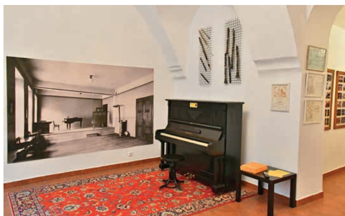
Návštěvníci výstavy si mohou zahrát na klavír.