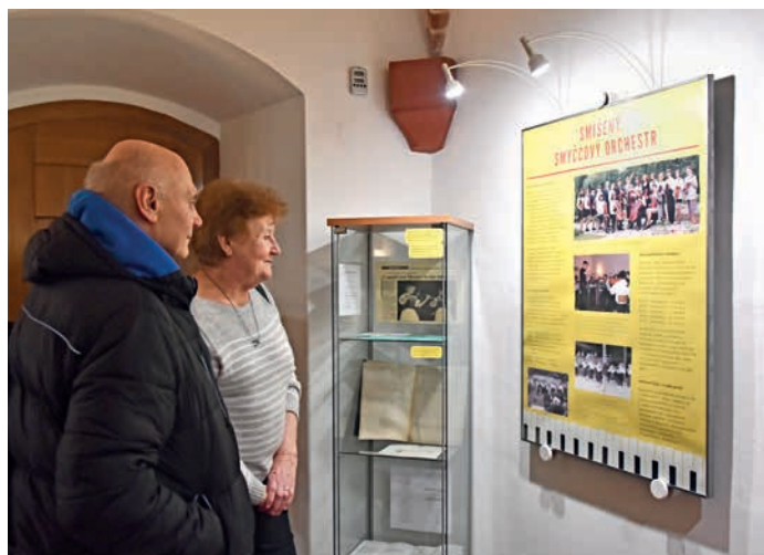
Výstavu ocení nejen bývalí a současní žáci školy, ale i návštěvníci z řad veřejnosti.