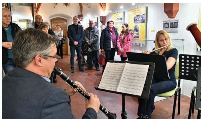
Hudba na vernisáži k výstavě o umělecké škole nesmí chybět.