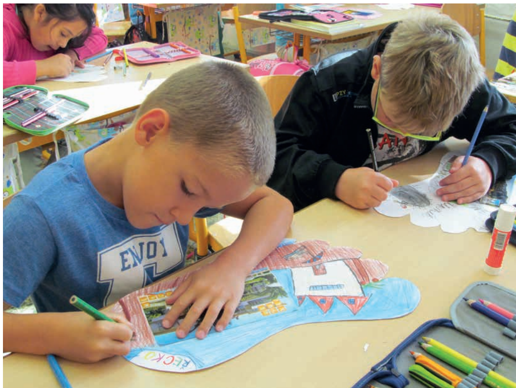
Individuální přístup k žákům je součástí výuky.

Vztahy mezi žáky i učiteli jsou pro nás důležité. Třídní učitelé s třídou pravidelně pracují, reagují na náznaky rizikového chování, podporují spoluprá-