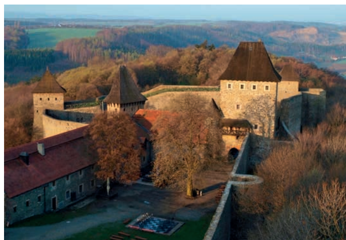
Hrad Helfštýn je oblíbenou turistickou destinací.

Pokud se chcete s areálem Helfštýna, jeho dějinami, současností i plány do budoucna seznámit důsledněji, a navíc se dostat na místa, kam se běžní návštěvníci