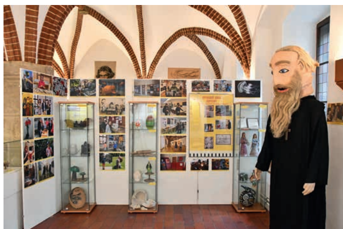
K vidění je i tvorba výtvarného oboru.