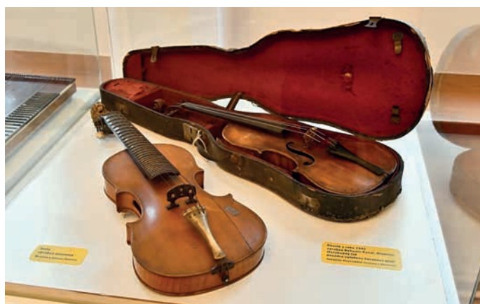
Mezi vystavenými exponáty jsou i tyto housle z roku 1941.