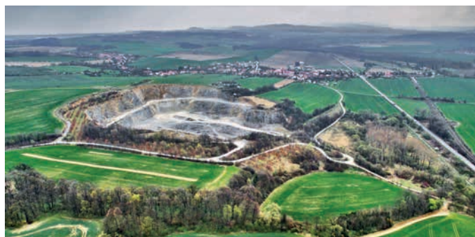
Cementárna těží vápenec také v černotínském lomu.

změně na koncernový podnik Cementárny a vápenky Hranice. Cementárna procházela modernizací, ale po třiceti letech provozu bylo rozhodnuto o výstavbě nové technologické linky na výpal slinku. V roce 1987 začala výstavba nové cementárny. Jednalo se o nový způsob výroby, z pů-