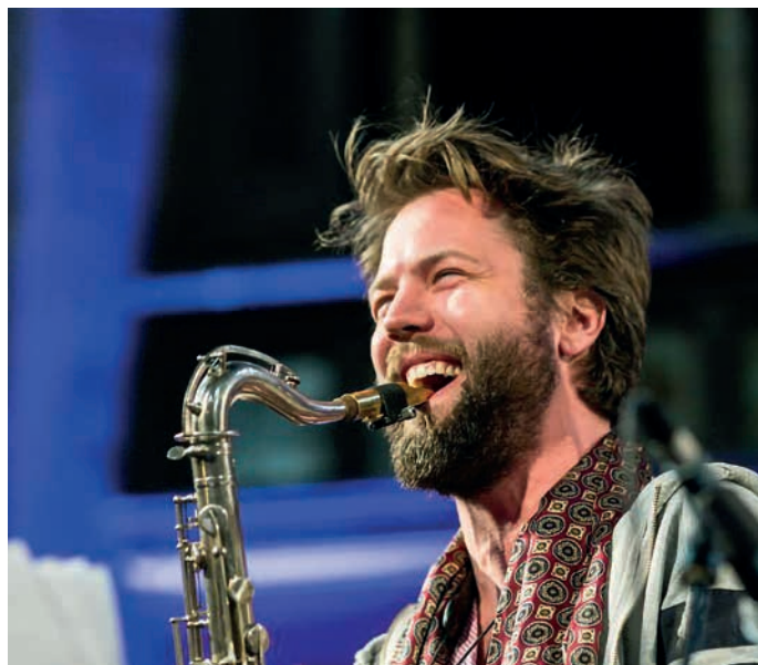
Guido Spannocchi.

Výtěžek z akce bude použit na podporu tří základních pilířů činnosti Společenského klubu Panenka – Panenka dětem do nemocnic, Adopce