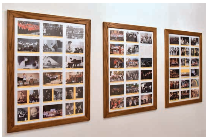
Fotografie dokumentují bohatou historii školy.