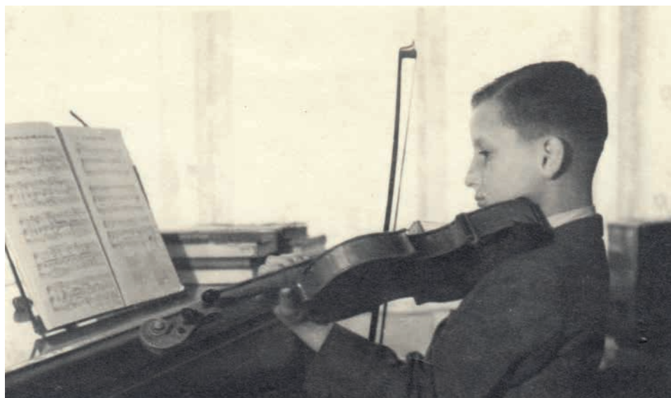
Hranický žák při hodině houslí.