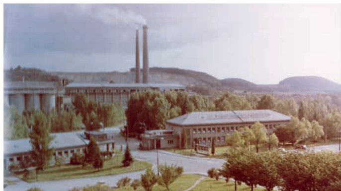
Pohled z roku 1979 na areál cementárny v pozadí s lomem Skalka.