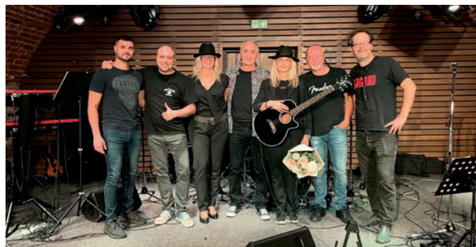
Kapela Joe Cocker Forever má v současnosti v repertoáru 19 hitů.

Koncert kapely Joe Cocker Forever se uskuteční v pátek 5. dubna od 20:00 hodin v Zámeckém klubu. Cena vstupenky je v předprodeji 200 Kč, na místě 250 Kč. Vstupenky můžete zakoupit v Turistickém informačním centru na zámku nebo online. (red)