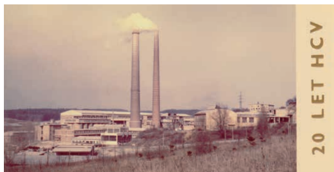
Pohled na areál cementárny v roce 1974, kdy si připomínala 20. výročí od spuštění výroby.

V roce 1960 zahájila výrobu poslední, čtvrtá rotační pec. V roce 1980 došlo k organizační