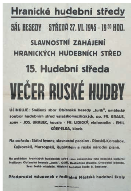
Plakát na patnáctou Hranickou hudební středou z roku 1945.