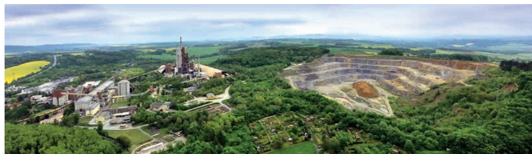
Aktuální letecký snímek nabízí pohled na areál cementárny a přilehlý lom Skalka.

Poté, co bylo v kruhové vápence v Černotíně v roce 1976 naposledy vypáleno vápno, začal objekt sloužit jako sklad brambor pro zemědělské družstvo se sídlem v Hustopečích nad Bečvou. Dno lomu využívala Okresní