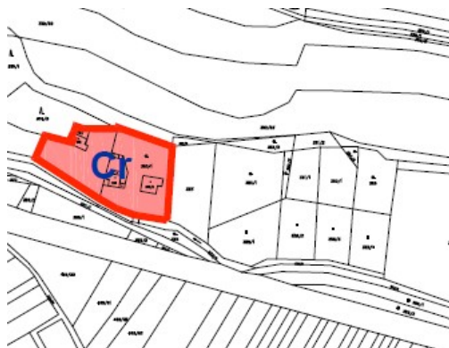
Výřez řešeného území – samostatná část zastavěného území západně od obce