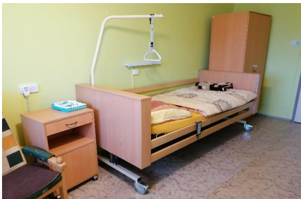
Obr. 11: Jednolůžkový pokoj