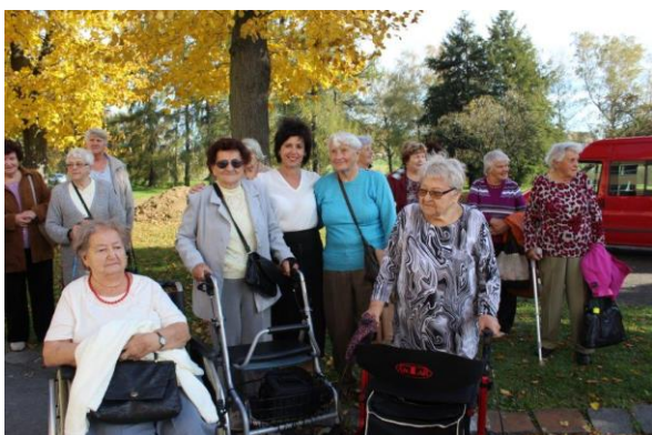
Obr. č. 3: Předávání panenek v nemocnici