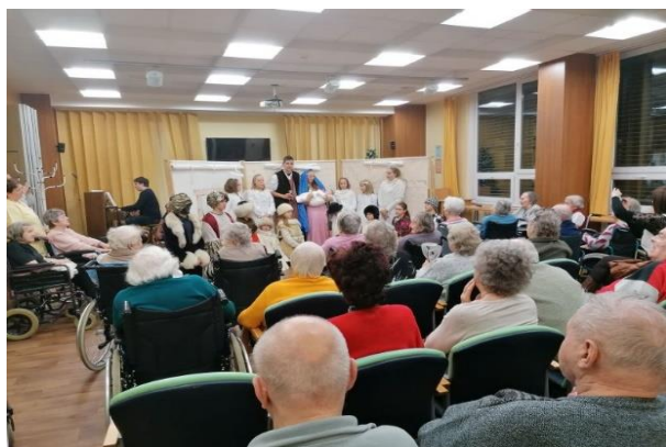
Obr. č. 33: Živý betlém