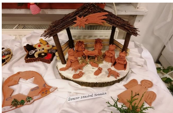
Obr. č. 5: Betlém DS v Galerii M+M