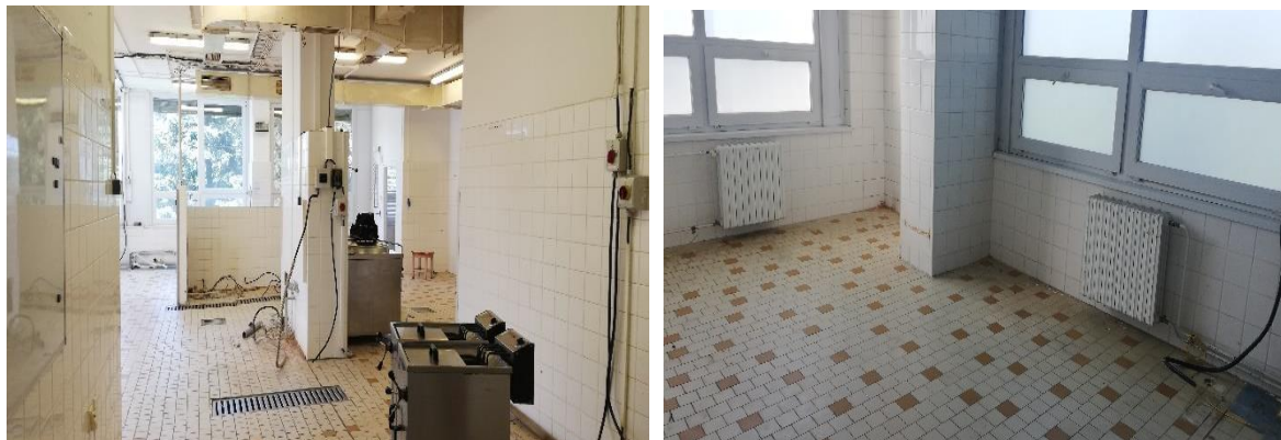
Obr. č. 19 a 20: Kuchyně po rekonstrukci