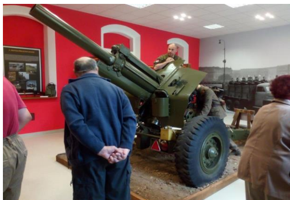
Obr. č. 29: Návštěva kasáren