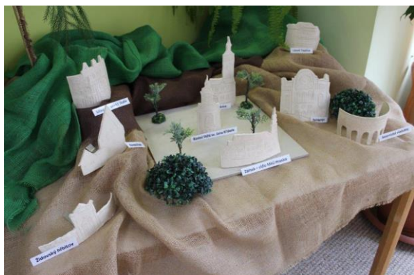
Obr. č.1: Keramický model Hranic