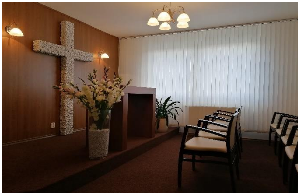
Obr. č. 13: Kaplička