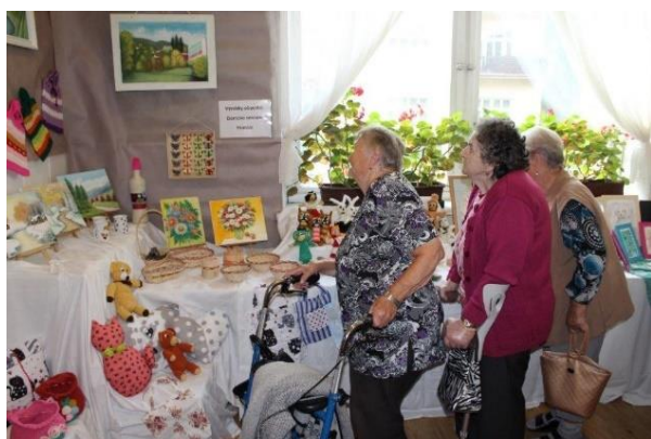
Obr. č. 27: Salon st. výtvarníků v Galerii M+M