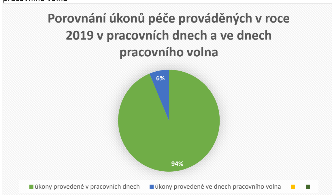
Graf č. 2: Porovnání úkonů péče prováděných v roce 2019 v pracovních dnech a ve dnech pracovního volna

Pečovatelská služba poskytuje bezplatnou službu, kromě nákladů na stravu, osobám uvedeným v §75 Zákona o sociálních službách č. 108/2006 Sb.