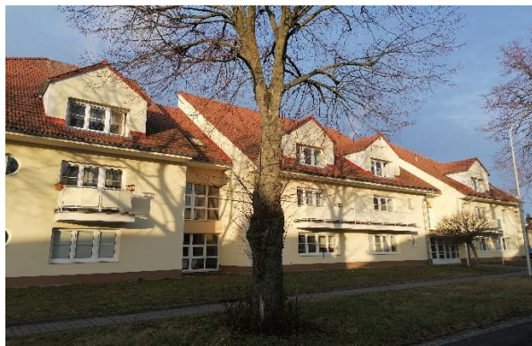
Obr. č. 7: Dům s pečovatelskou službou