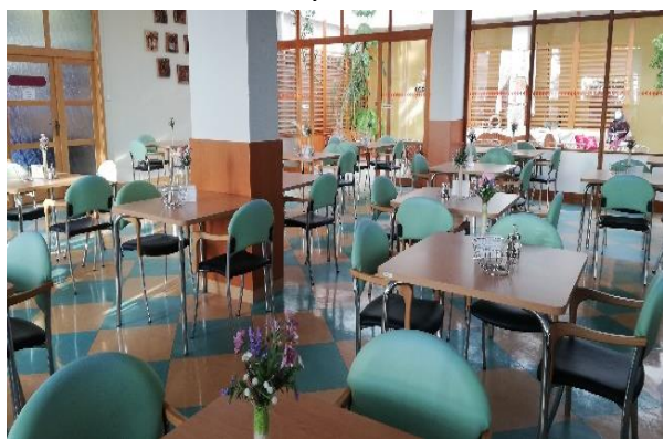
Obr. č. 15: Jídelna obyvatel