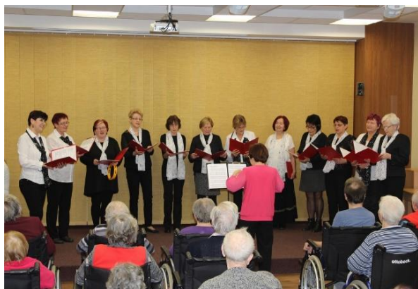
Obr. č. 23: Tříkrálový koncert