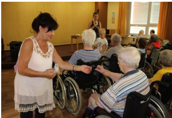
Obr. č. 28: Přednáška o nevidomých