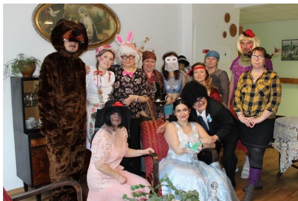
Obr. č. 25: Rej masek