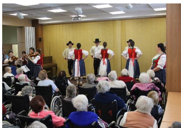
Obr. č. 24: Vystoupení cimbálky