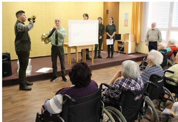
Obr. č. 30: Stínové divadlo