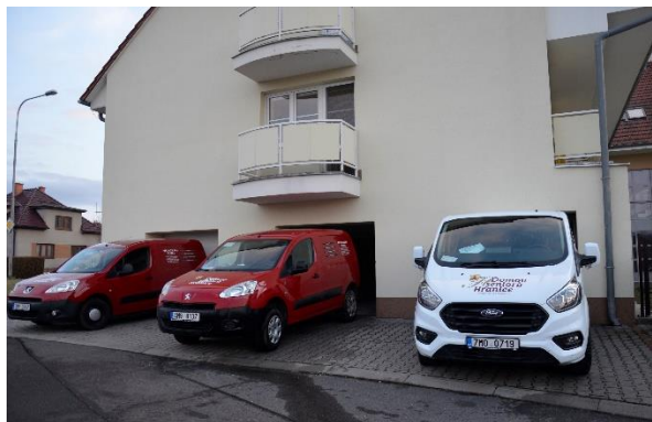
Obr. č. 8: Vozidla Pečovatelské služby