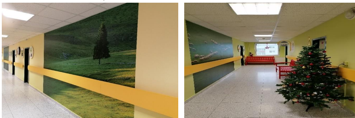
Obr. č. 9 a 10: Pohled na společnou chodbu v DZR

V závěru roku se změnil interiér společné chodby. Ve spolupráci s architektkou Zuzanou Korábovou se zde implementovaly 4 velkoformátové fotografie zachycující krásnou scenérii beskydské přírody. Základem se staly příjemné žluté a zelené tóny, doplněné o červené lavičky uzpůsobené potřebám seniorů. Vyměnily se všechny protipožární dveře. Nové úpravy se dočkal i orientační systém, prostřednictvím kterého bylo inovováno označení pokojů.