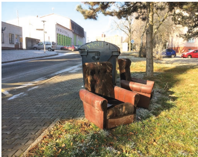
Objemný odpad u kontejneru na směsný komunální odpad.