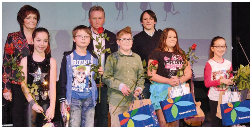
Mladí finalisté Pop Noty předvedli vynikající výkony.