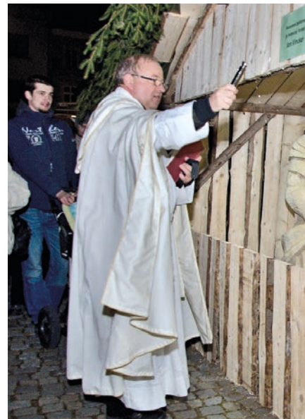
Uskutečnilo se i svěcení betléma, jehož autorem je...