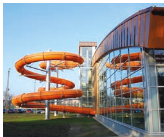
Stavbou roku byla například i hranická plovárna, která loni slavila desetileté jubileum.

Stavební akce musí být zkolaudována do 31. prosince 2016. Investorem může být ja-