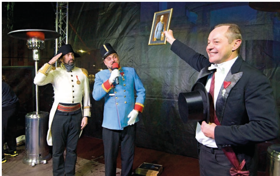
Vánoce se odehrávaly v duchu časů císaře pána.