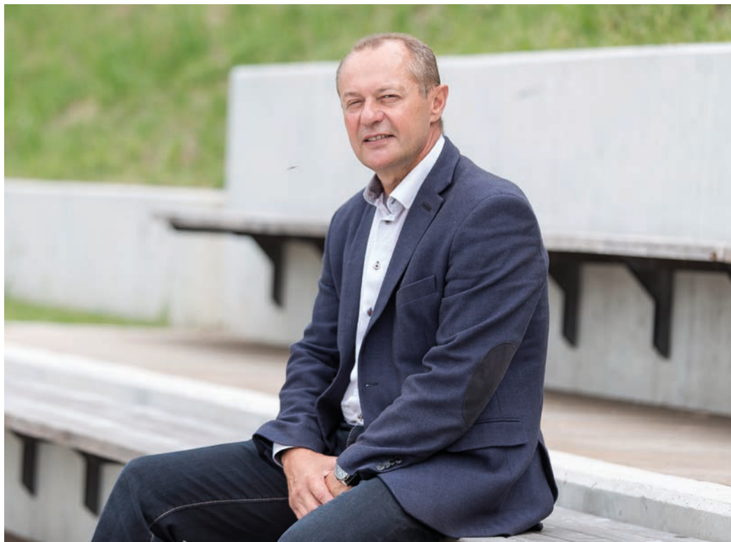
Starosta města Jiří Kudláček

Postupně pokračují rekonstrukce sídlišť, chodníků a ka-