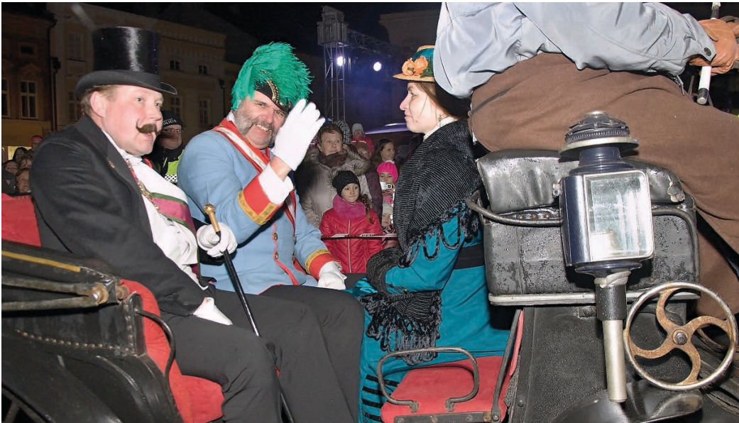
Vánoční jarmark nabídl v prosinci roku 2016 bohatý program.