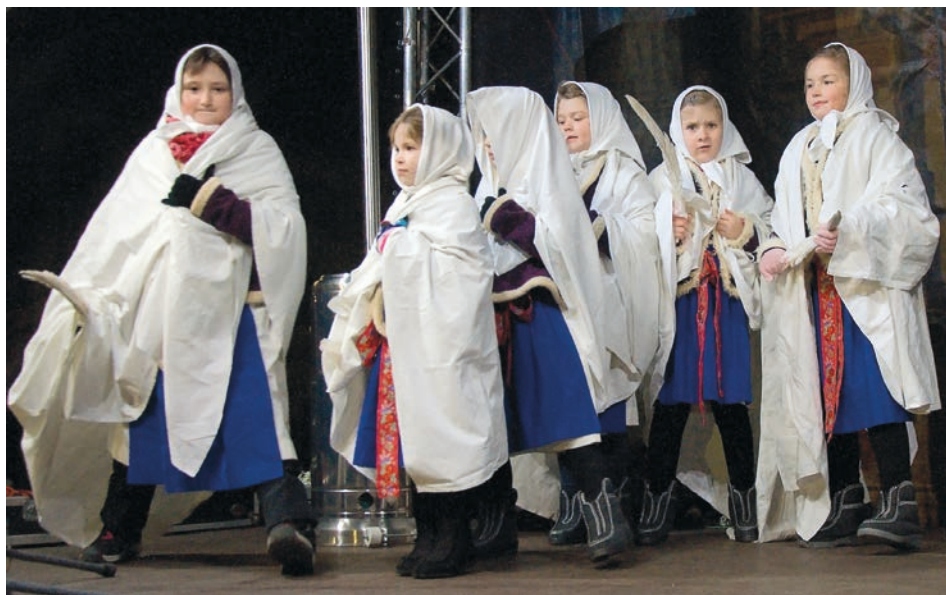
Program si připravily i děti z folklórního souboru Rozmarýnek.