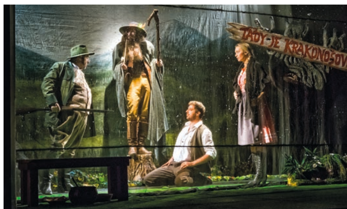
Pohádka zaujme dětské i dospělé návštěvníky.

Malebná scéna, oduševnělá hudba, chytrý a vtipný text, vynikající herecké výkony. To jsou Krkonošské pohádky.