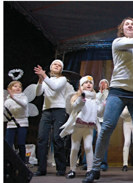
V průběhu prosince vystoupily na Masarykově náměstí.