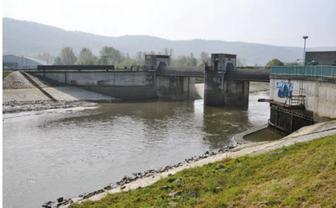
Jednou z nejdůležitějších akcí, která se týká budoucnosti města, je rozšíření jezu o třetí pole (na snímku vlevo). Povodí Moravy by mělo již letos získat stavební povolení a vybrat firmu, která to provede.

Nejdůležitější pro Hranice je rozšíření jezu o třetí pole . Povodí Moravy by mělo v roce 2017 získat stavební povolení a vybrat