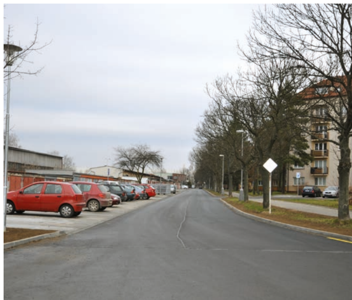
Spravená příjezdová cesta a chodníky, nová parkovací místa a kontejnerová stání, vydlážděné vjezdy před garážemi na sídlišti Struhlovsko.

Nová víceúčelová sportovní hřiště začala loni sloužit v místních částech Hranic – ve Velké a Středolesí. Ve Velké se hřiště stalo součástí většího sportovně-kulturního areálu u sokolovny. Má umělý asfaltový povrch o velikosti zhruba 21 x 42 metrů,