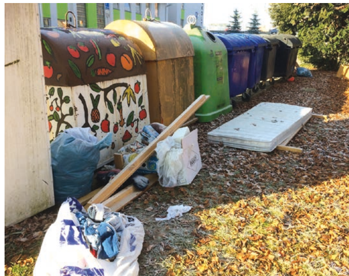
Objemný odpad v okolí kontejnerového místa na separovaný odpad naproti sídla společnosti Ekoltes Hranice.

Aktivová společnost Ekoltes Hranice od Nového roku, tedy od 1. ledna 2017 nebude svážet odpad v pytlích ani jakýkoli jiný odpad umístěný mimo sběrné nádoby typu popelnic. Každý občan Hranic má možnost pořídit si libovolný počet popelnic.