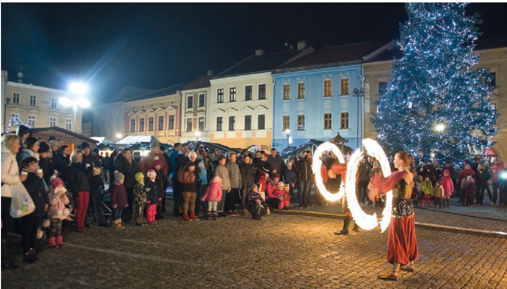
Působivá byla také ohňová show.