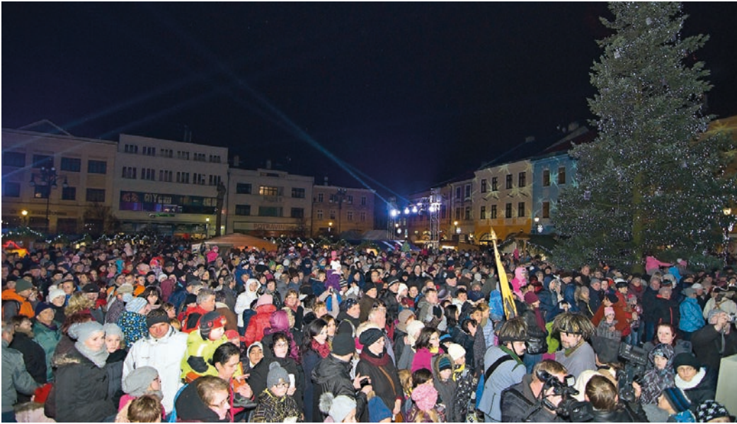
Rozsvěcení vánočního stromu 1. prosince doprovázela působivá světelná show.