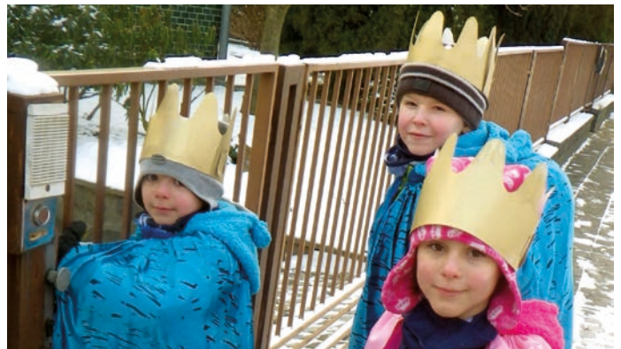
Tři králové budou v lednu koledovat v Hranicích.