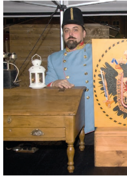
Lidé mohli využít c. k. poštovního úřadu s tiskárnou.