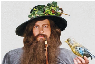
Krkonošské pohádky v Hranicích str. 13