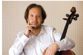
Manželské kontrapunky v Koncertním sále str. 14