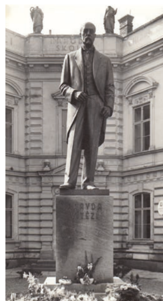
Socha Masaryka na Školním náměstí v roce 1948.

Zadání soutěže je k dispozici na úřední desce města Hranic ( www.mesto-hranice.cz ). Termín pro odevzdání soutěžních návrhů je 15. duben . Po vyhlášení výsledků budou soutěžní návrhy představeny na společné výstavě, doba realizace bude závislá na charakteru vybraného díla. (bak)