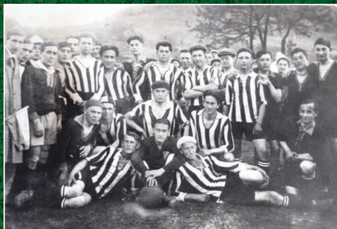
Sestava SK Hranice v roce 1920.

Přijďte se podívat, na fotkách uvidíte známé tváře, možná i sami sebe. Výstava je k vidění do neděle 5. května. (ms)