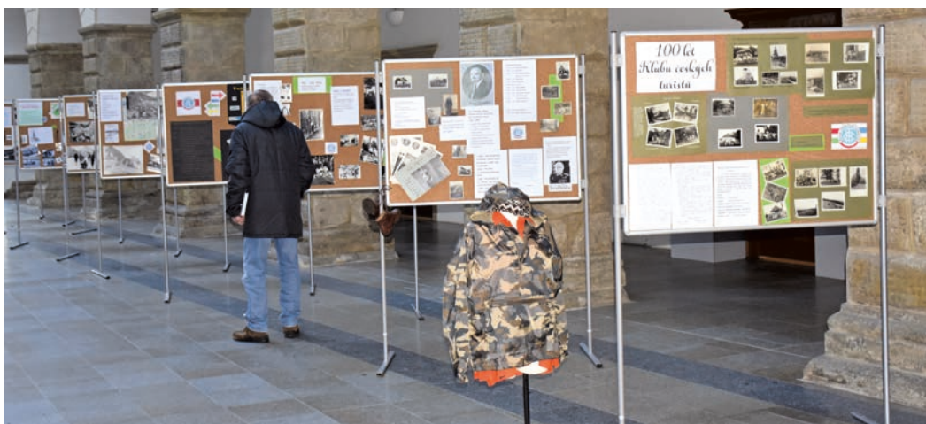
Turisté ke stoletému výročí uspořádali i výstavu ve dvoraně hranického zámku. Využili i podklady z původní kroniky hranických turistů, jejíž první zápis byl 29. ledna 1919 a poslední v roce 1938.