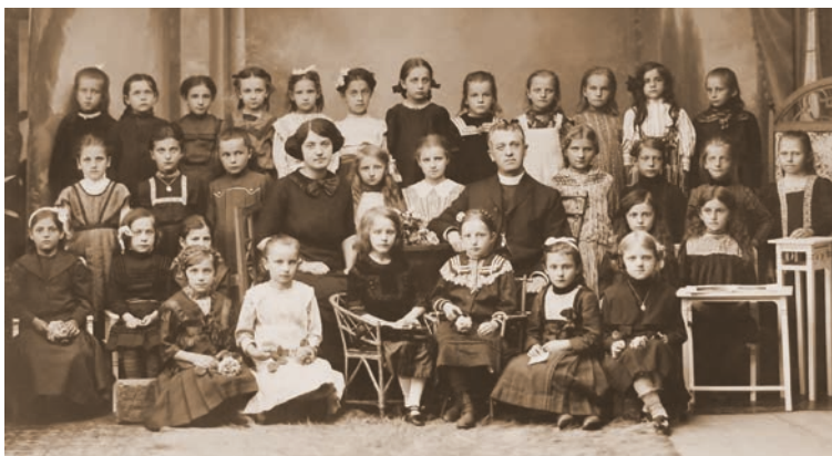
Před sto lety nebylo zřejmě vyučování žádná legrace, alespoň podle této fotografie hranické dívčí třídy z počátku 20. století.