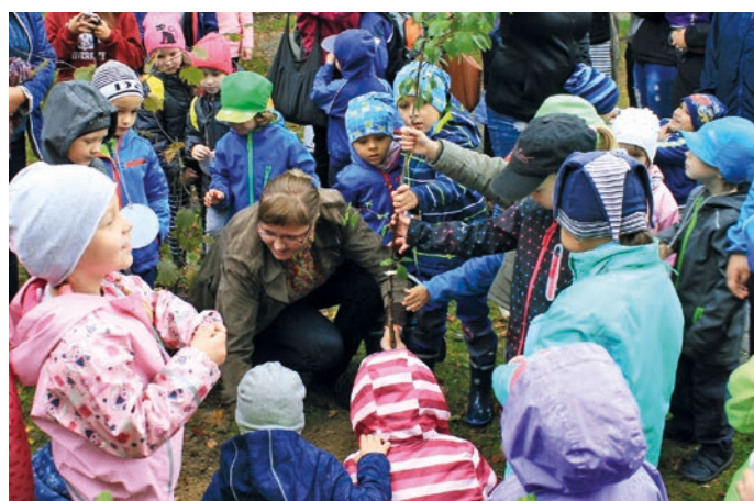
Školka na Struhlovsku se pyšní přírodními zahradami, které prošly před časem rekonstrukcí, stejně jako interiéry.

Učíme děti vnímat rytmus a také spojení hudby s pohybem. Navštěvujeme Základní uměleckou školu v Hranicích. Organizujeme spoustu hudebních a divadelních představení.