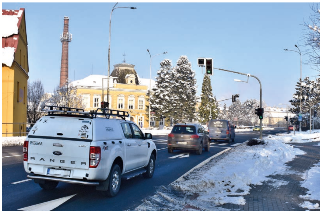
Na křižovatce Motošín jsou čidla, která vyhodnocují dopravní situaci a podle toho regulují provoz semaforů.

Po vyhodnocení provozu za zhruba dva měsíce používání kamerových čidel je zřejmé, že došlo ke značnému zlepšení průjezdnosti i průchodnosti křižovatkou. Zásadní změnu ale může přinést pouze Palačovská spojka. (bak)