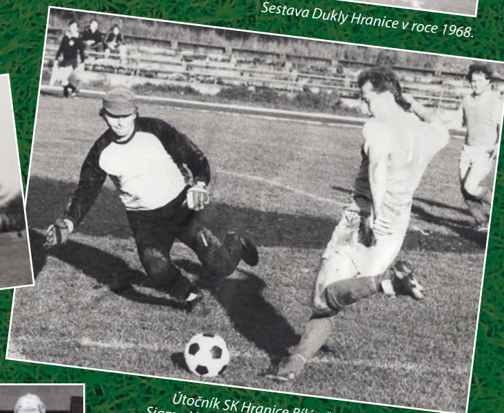
Útočník SK Hranice Bílý před brankářem Poruby. Sigma Hranice tehdy na domácím hřišti vyhrála 3:0. Snímek je z května 1989.