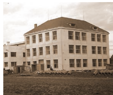
Stavba školy pro ženská povolání – dnešní Střední zdravotní škola ve Studentské ulici.