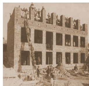
Stavba české měšťanské školy v Hranicích.