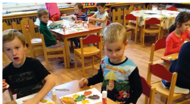
V Mateřské škole Sluníčko rozvíjejí samostatnost a osobnost dětí.