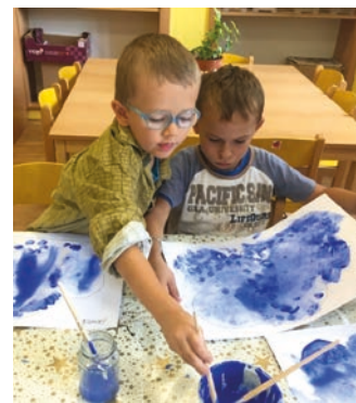
Děti z MŠ Šromotova pastelka jsou úspěšné na výtvarných soutěžích.

Martina Polláková, vedoucí učitelka MŠ Šromotova pastelka