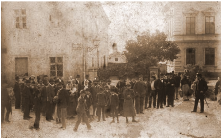
Zápis do českých škol na Školním náměstí v Hranicích. Snímek z roku 1896.

V měsíci březnu se v České republice slaví Den učitelů. Pripadá na 28. března, tedy na den, kdy se narodil Jan Amos Komenský. Připomeňme si prostřednictvím historických fotografií některé hranické školy. (nad)