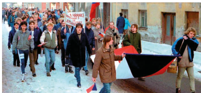
Listopad 1989 v hranických ulicích. Generální stávkou zachytil fotograf Martin Trískala.

I když bude ve výstavních sálích na Staré radnici v Hranicích zahájena až ve čtvrtek 14. listopadu, již nyní v hranickém muzeu schraňují materiály, dokumenty i předměty, které dobu osmdesátých let připomenou. Pokud máte cokoli, čím byste chtěli přispět, budeme rádi, když nám předměty zapůjčíte. (nad)