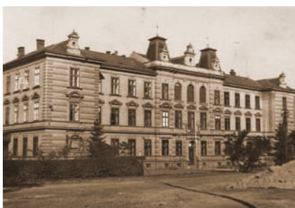
Lesnická škola v Hranicích.