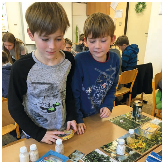
Na Základní škole Šromotovo chtějí, aby každé dítě zažívalo ve škole pocit úspěchu.

Podporujeme u dětí čtení knih. Jsme přesvědčeni, že děti, které rády a dobře čtou, se rády