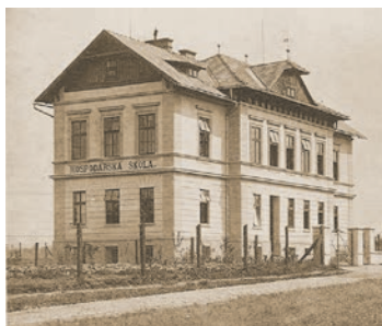
Hospodářská škola na snímku z roku 1904. Dnes je v této budově v Jungmannově ulici domov mládeže Střední lesnické školy.