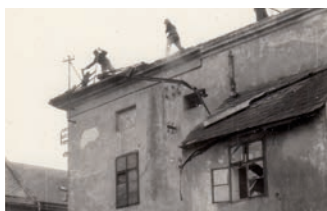
Fenomén hasičství. K vidění budou i historické snímky z požárů v Hranicích, mimo jiné i z požáru v předzámečí.

Výstava „Fenomén hasičství“ představí historii hasičských sborů na Hranicku. K vidění budou hasičské přístroje, výstroj, historické fotografie. Návštěvníci se dozvědí o největších požárech