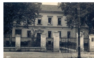
Hranická nemocnice je na místě, kde ji známe od r. 1939. Do té doby byla v Teplické ulici.

Na výstavě budou k vidění dobové fotografie, ale také historické lékařské nástroje a pomůcky. Vernisáž výstavy se uskuteční ve čtvrtek 26. září , potrvá do 5. ledna následujícího roku. (nad)