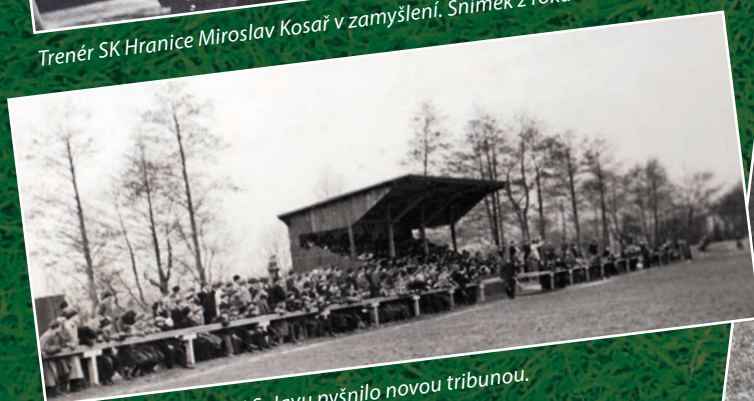
V roce 1943 se hřiště U Splavu pyšnilo novou tribunou.