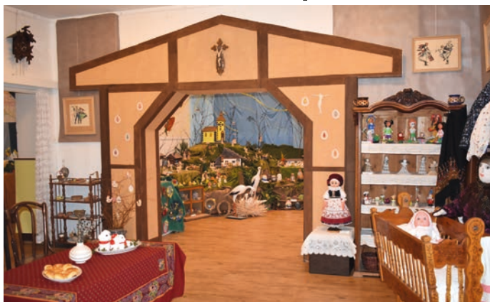
Velikonoční výstavy v Galerii M+M jsou pokaždé jiné, vždy návštěvníky překvapí.

Výstava bude k vidění do pátku 19. dubna a většina z vystavených předmětů bude prodejná. (rk)