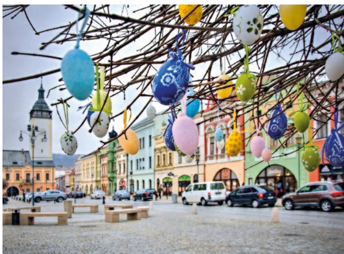
Kraslicovník začnou Městská kulturní zařízení Hranice zdobit ve středu 27. března.

Velikonoční atmosféru navodí letos v centru Hranic opět kraslicovník, tedy strom plný kraslic. Tato milá tradice by nemohla vzniknout bez spolupráce obyvatel města, kteří každoročně přispívají malovanými vajíčky. Proto se i letos obrací Městská kulturní zařízení Hranice, která tuto akci organizují, na obyvatele města s prosbou, aby i letos přispěli kraslicemi.