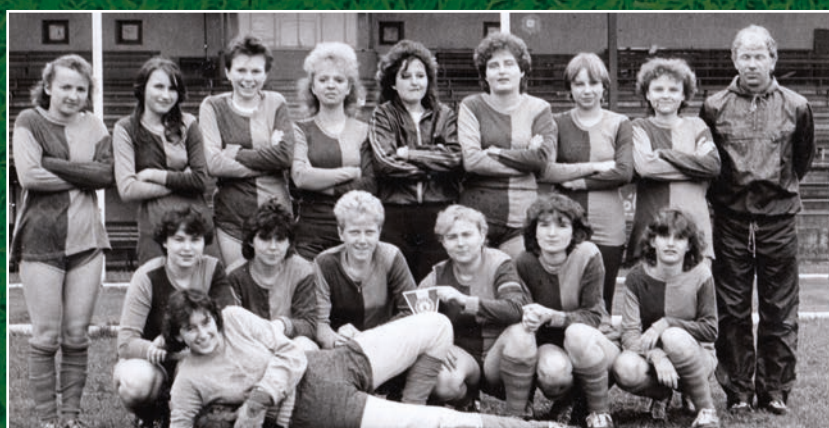
Poznáte se? Družstvo žen SK Hranice na snímku z roku 1989.