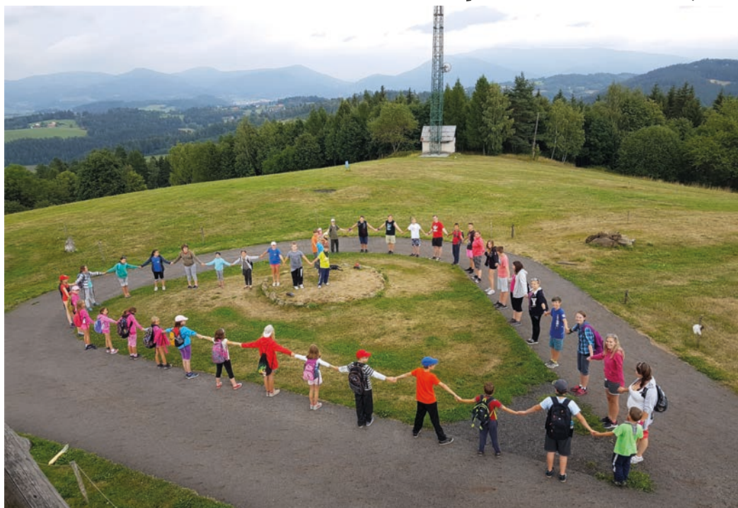
Výlet hranického Domu dětí a mládeže na Malé Fatře.

Spolupracujeme s dalšími organizacemi a složkami v našem městě, jako jsou Městská kulturní zařízení, Městská policie, či Armáda České republiky. Spo-