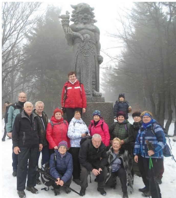
Hraničtí turisté nehledí na počasí a vyrážejí na túry i v zimním počasí.