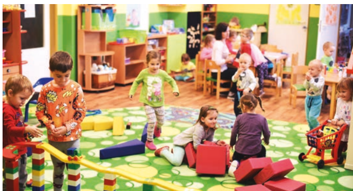
Děti ve školce využívají keramickou pec, polytechnický koutek s ponkem, mají lekce angličtiny a spoustu dalšího.

Naši čtyřtřídní mateřskou školu s pohádkovým jménem najdete na okraji sídliště Hro-