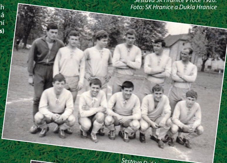
Sestava Dukly Hranice v roce 1968.