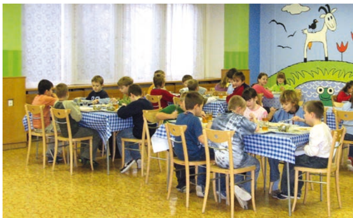
Co jedí děti v Červené jídelně? Rodiče mohou ochutnat.