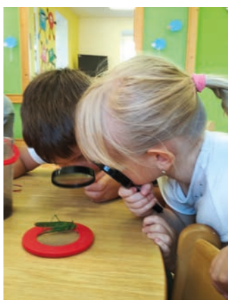
V koutcích živé přírody ve třídě, děti z mateřské školy zkoumají různé živočichy.