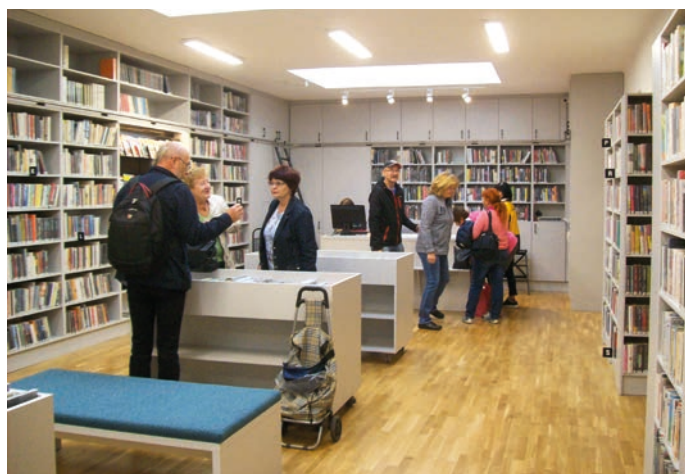
Po rekonstrukci se hranická knihovna stala ještě příjemnějším místem.