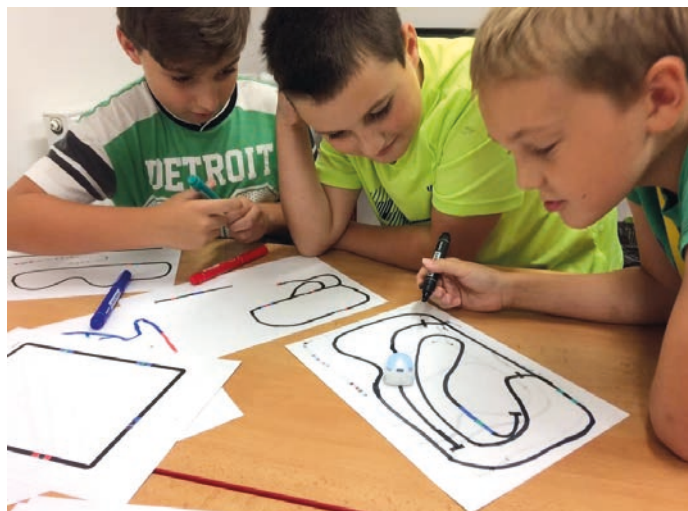
Do výuky škola zařazuje také nové trendy jako robotiku, která motivuje žáky k programování.

Úspěšně se nám daří připravit žáky na další vzdělávání. Napří-