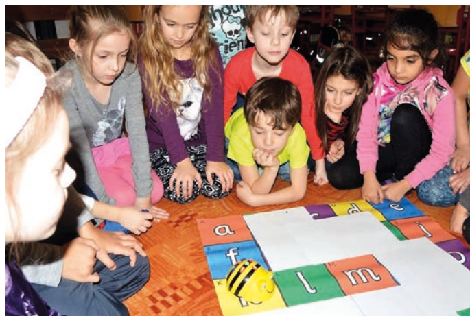
Každý žák na Základní škole Struhlovsko může zažívat radost z poznání a může rozvíjet ty schopnosti, které mu jsou nejbližší.

Díky širokému zaměření, zapojení do řady projektů, přínášejících široké spektrum mnoha nadstandardních aktivit, a výuce založené na prožitku a vlastní zkušenosti může každý