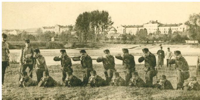
Jízdní kadetní škola, rok 1893.

Unikátní výstavu o hranických vojenských ústavech a vojenské akademii můžete zhlédnout ve výstavních síních Staré radnice od středy 28. června. Výstava představí historii, osobnosti, architekturu a exponáty školních ústavů, které sídlily v dnešních kasárnách generála Otakara Zahálky v letech 1856 až 1950. Slavnostní vernisáž proběhne na Staré radnici ve středu 28. června v 17 hodin. Výstava potrvá do 8. října. (such)