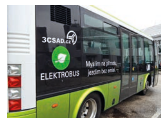
Nové elektrobusesy by se mohly v ulicích města objevit už v říjnu.

polepem. Do tvorby polepu autobusů v brzké době zapojíme i obyvatele Hranic,“ dodal Michal Birkáš. (red)