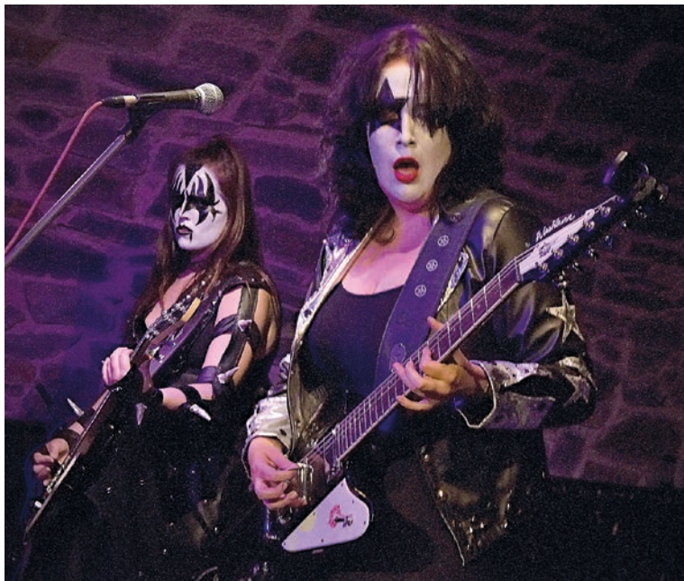
O pořádnou show se postarala kapela Kiss Moravian Girls, která koncertovala v dubnu v Zámeckém klubu. Čtveřice dívek nadchla posluchače nejen kvalitní hudbou, ale i celkovou image, která byla věrnou kopií původní stejnojmenné americké skupiny.