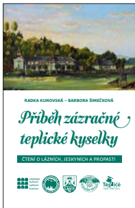
Titulní strana publikace.