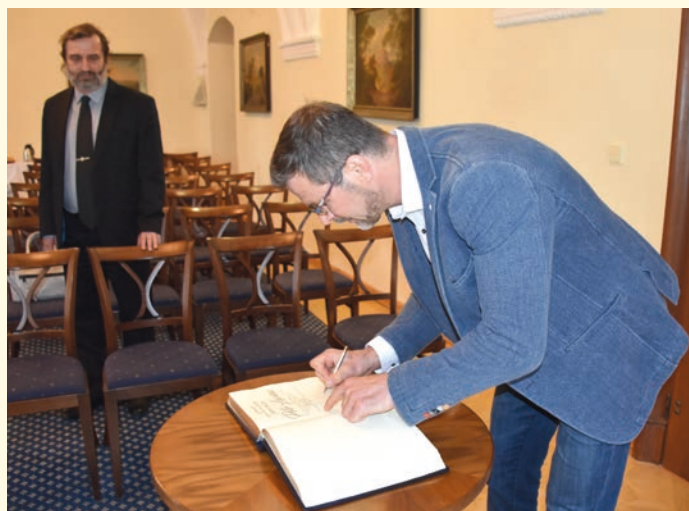
Hostem na letošním vyhlášení nejlepších sportovců města Hranic, které se konalo 25. dubna, byl Jiří Lacina, bývalý úspěšný judista a trenér olympijského vítěze z Ria de Janeiro v roce 2016 Lukáše Krpálka. Jiří Lacina, který byl vyhlášen trenérem roku 2016, se zapsal do Zlaté knihy města. (bak)