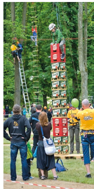
Loni se akce vydařila.

Na akci se organizačně podílí Hranická rozvojová agentura, dále skupina dobrovolníků a kancelář Místní akční skupiny Hranicko. Akci finančně podpořilo město Hranice i Mikroregion Hranicko a Olomoucký kraj. (bak)