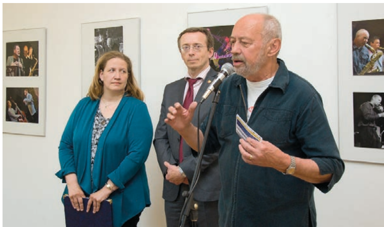
Výstavu fotografií z minulých ročníků Evropských jazzových dnů zahájila vernisáž ve středu 10. května. K vidění byly až do konce května fotografie Jiřího Necida, Milana Kaštovského a Pavla Diatky.