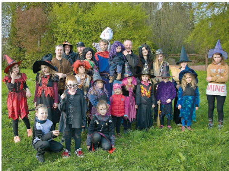
Také do Hranic se poslední dubnový den slétli čarodějnice, jezibaby, černokněžníci a jiné strašidelné bytosti. Děti přišly v pestrých převlecích a užily si odpoledne plně her a zábavy.