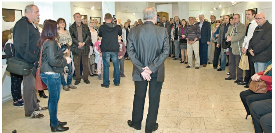
V všech sálech Staré radnice je k vidění dílo hranického malíře, ilustrátora a výtvarného teoretika Radovana Langera. Výstava je přístupná do 14. června.