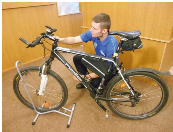
Registrace jízdního kola trvá zhruba 30 minut.

Projekt „Hranice – Forenzní značení jízdních kol“ byl finančně podpořen Ministerstvem vnitra ČR v rámci Programu prevence kriminality v roce 2016. (bak)