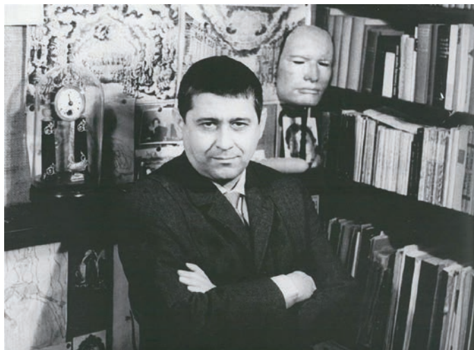
Slavný hranický rodák Jiří Brdečka zemřel ve věku 65 let.

Praha ovlivnila Brdečkův profesionální život mnohem více než Hranice. Z psychologického hlediska můžeme Hranicím přisoudit jistou dávku vlivu. Jednak Hranice jsou rodištěm a místem jeho dospívání, jak se říká her a malin nezralých, tedy chvíl, které u většiny patří k těm šťastnějším v životě, a na tyto chvíle se určitě nezapomíná. O tom, že na Hranice nezapomněl, svědčí i to,