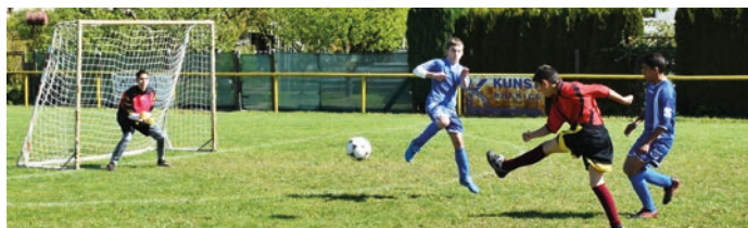
Na fotbalovém hřišti byly k vidění pěkné útočné akce.