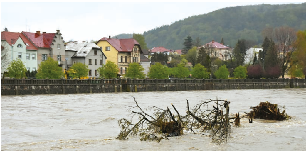
Po řece připlul i mohutný strom.