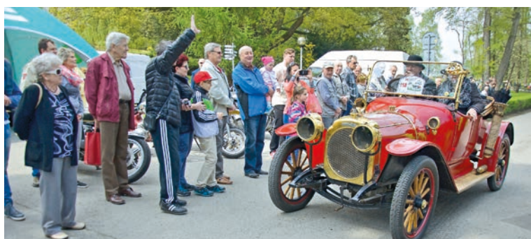
V lázeňském areálu v Teplicích nad Bečvou zahájili v sobotu 13. května letní sezonu. Pro návštěvníky byl připravený bohatý kulturní program v podobě koncertů, představení i prohlídek lázeňských domů.