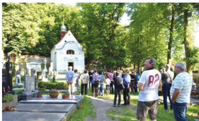
Noc kostelů v Hranicích nabídla mimo jiné i komentovanou prohlídku areálu Kostelíček. Zájemce provedl historik Jiří Nebeský.