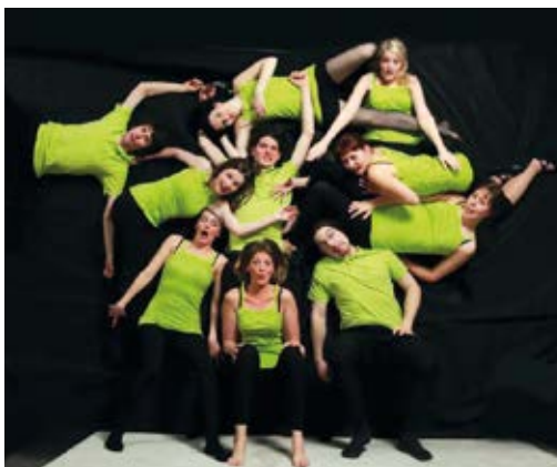
Improvizační dovednosti skupiny Olivy pobaví hranické publikum v úterý 24. července.