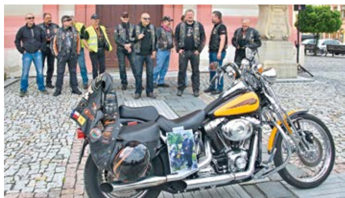
Na hranickém náměstí burácely desítky harleyů a dalších luxusních i historických motorek. Uskutečnila se tradiční motomše, která nabídla veřejnosti prohlídku strojů i sledování spanilé jízdy přes okolní vesnice.