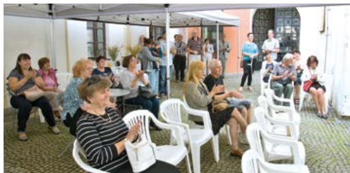
Návštěvníky vernisáže výstavy Řemeslo má zlaté dno čekal také kvíz. Pokoušeli se určit, k čemu sloužily různé předměty z minulosti.

si jít. Například na mlynářské dílně si návštěvníci sami pome-lou obilí, odnesou domů pytlíček s moukou a získají originální recept na placky. Mlynářskou dílnu připravuje muzeum ve spolupráci se Studiem Bez Kliky. (red)