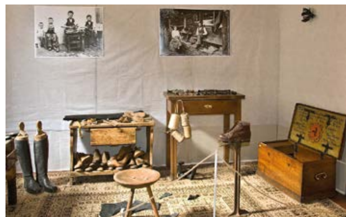
Významný obuvnický cech v Hranicích připomíná na výstavě obuvnická dílna.