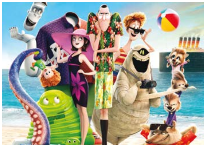
Ke skvělým rodinným filmům patří také animovaná komedie Hotel Transylvanie 3: Příšerózní dovolená .

Příznivce akčních filmů čeká ve čtvrtek 5. července snímek Avengers: Infinity War , který završuje desetiletou cestu filmovým světem studia Marvel a přináší na stříbrná plátna nejsmrtonosnější a neultimátnější válku všech dob.