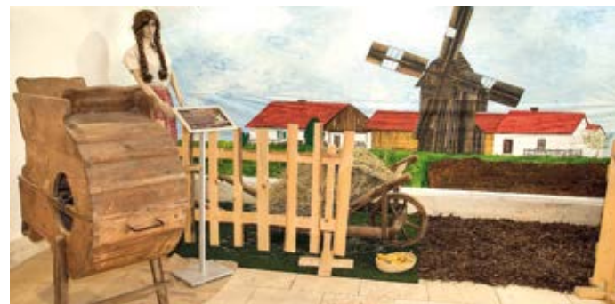
Hranicku se říkávalo Moravské Holandsko. Za tento název mohl velký počet větrných mlýnů. Dnes se v regionu dochovaly jen tři.