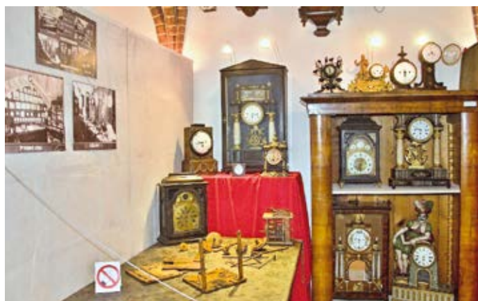
Nejrůznější hodiny ze sbírek hranického muzea jsou na výstavě k vidění v hodinářské dílně.