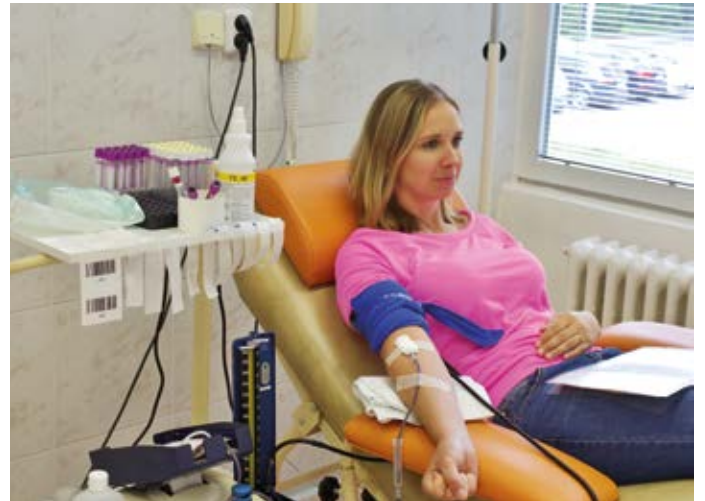
Více o dárcovství krve se lidé dočtou na facebooku nemocnice či na webových stránkách. Ilustrační foto: Nemocnice Hranice

„Budeme rádi za každého nového dárce krve a potenciálního dárce kostní dřeně,“ doplnila primářka transfúzního oddělení. (red)