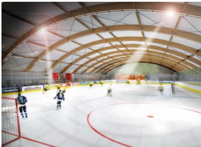
Vizualizace. Obdobně může vypadat hranický zimní stadion.

O vládních penězích má být definitivně jasno v červenci. K tomu mají Hranice příslibenu