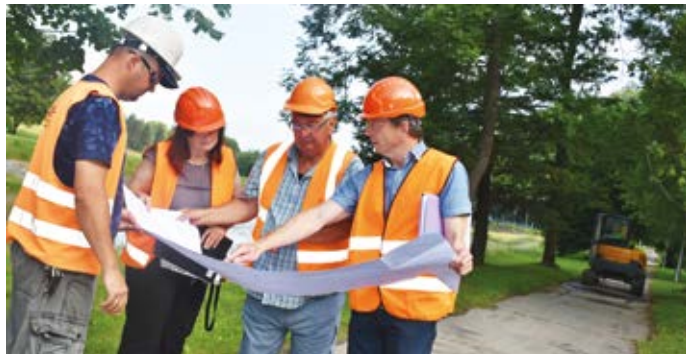
Na začátku června se předávalo staveniště a zahajovala stavba cyklostezky.

V plánu je také prodloužení stávající ústecké cyklostezky z Ústí dále na Skaličku v délce asi jeden a půl kilometru. Na