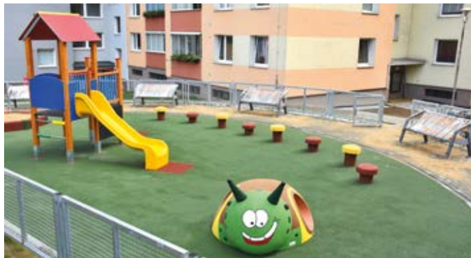
Na sídlišti Nová vyrostlo nové dětské hřiště s netradičními herními prvky.

360 bytů a žije zde zhruba pět procent z celkového počtu obyvatel města. Jedná se o svažitě území na severozápadním okraji města se špatným propojením na městské centrum. (bak)