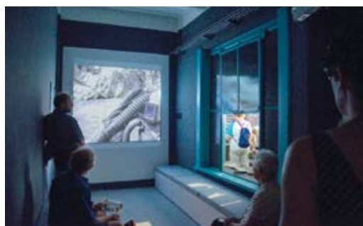
Jedna z místností nového infocentra slouží jako kino, kde běží krátký film o výzkumech v Propasti.