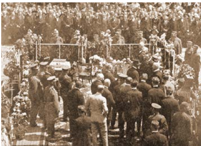
Prezident Masaryk v Hranicích.