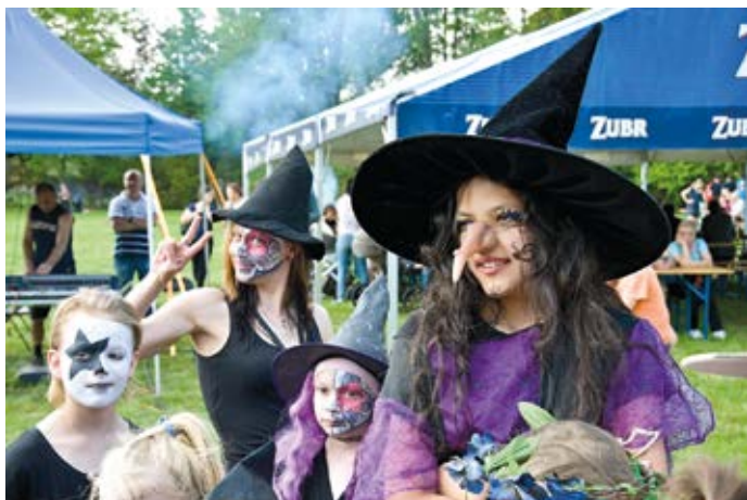
Do Hranic se stejně jako do jiných měst sléty čarodějnice.