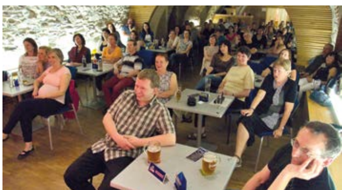
Nejoriginálnější česká a cappella Yellow Sisters odstartovala v Zámeckém klubu tradiční jazzové dny v Hranicích.