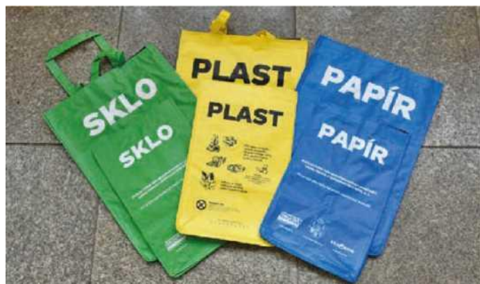
Na třídění odpadu si mohou lidé ještě bezplatně vyzvednout tašky na Městském úřadě Hranice, Pernštejnské nám. 1, ve 2. patře, kancelář č. 316.

Do odpadového hospodářství pak spadají i další drobnější výdaje. Například odstraňování černých skládek stojí téměř 100 tisíc korun. Mobilní svoz nebezpečného odpadu z místních částí dalších 54 tisíc korun. Celkem tedy město doplácí téměř 10 milionů korun a tato částka v příštích letech rozhodně nebude klesat, spíše naopak.