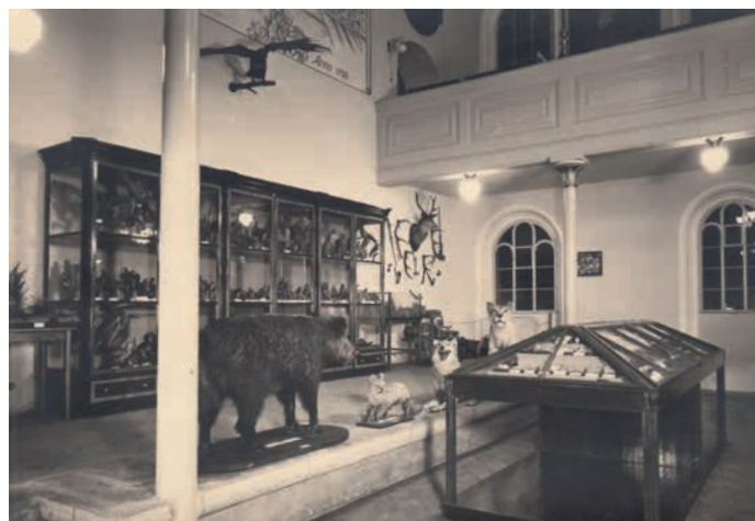
Muzejní expozice byla vybudována v hranické synagoze za okupace ve 40. letech 20. století.

na Moravě, Gallašovy knihovny, nebo obrazy hranického malíře Tadeáše Milliana, tzv. Kelečský poklad, který zakopal neznámý kupec asi v roce 1002, skříň architekta Dušana Jurkoviče, knihu věnovanou Josefem Dobrovským a mnohé další.