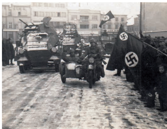
Příjezd německé armády do Hranic, 15. března 1939.