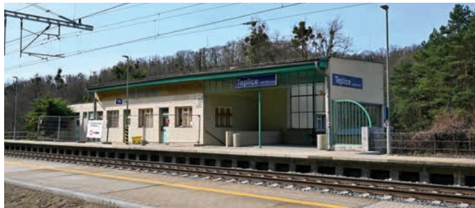
Teplické nádraží.

Již v roce 2018 město Hranice otevřelo v bývalé železniční stanici Teplice nad Bečvou Infocentrum Hranické propasti, kde jsme se snažili návštěvníkům ukázat i to, co je pod hladinou jezírka. Navíc se po několikátém jednání podařilo velkou část nádraží koupit, domluvit se se Správou železničních cest a začít