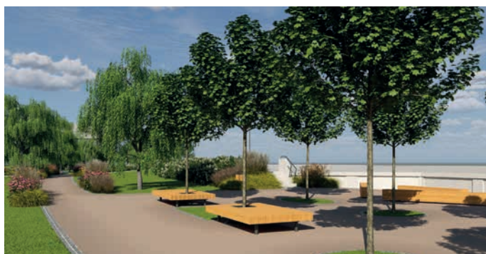
Vizualizace budoucí podoby nábřeží.

Projektem je komplexně řešeno nábřeží podél Kropáčovy ulice. Součástí revitalizace jsou kolmá parkovací stání, stanoviště kontejnerů a manipulační plochy, pěší komunikace a odpočinkové zóny, stavební úpravy stávajícího objektu pro potřeby závlahového systému, terénní úpravy, objekty u ochranné zdi, přípojky inženýrských sítí, mobiliář a výtvarné a herní prvky. Provedeny budou sadové úpravy a vybudován automatický závlahový systém, dešťová kanalizace a akumulace