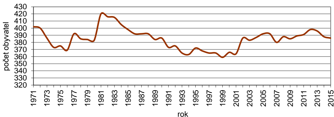
tab. 19 Vývoj počtu obyvatelstva v obci Býškovice

Pramen: ČSÚ, Databáze demografických údajů za obce ČR